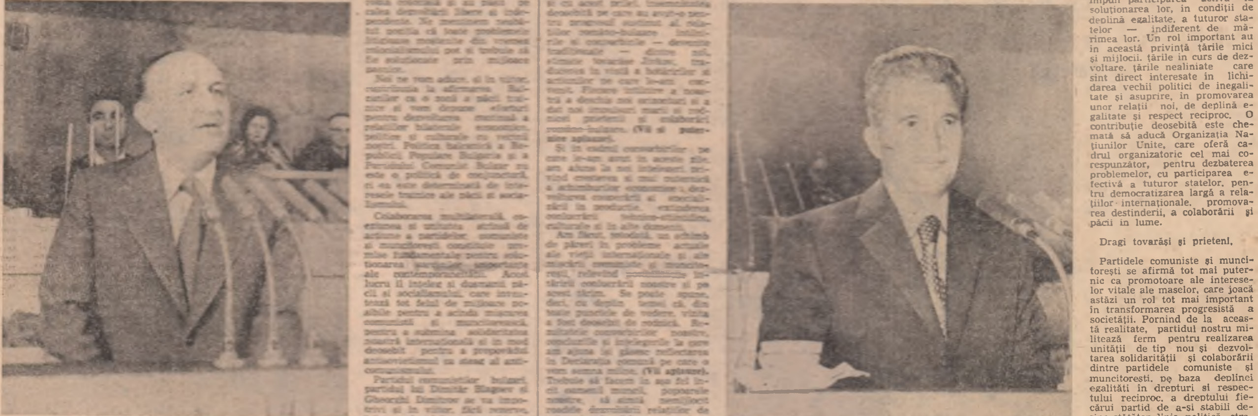
Un sistem alături de popoarele care luă pentru independență, din Africa de Sud, Namibia și Zimbabwe, pentru ca să trăiască în pace și prosperitate. Fostul președinte al Republicii Populare Bulgare, Todor Jivkov, a avut o discuție cu tovarășii săi din România. El a spus că este deosebit de important să se realizeze în continuare procesul de dezvoltare și consolidare a relațiilor noastre multilaterale în domeniul cultural.