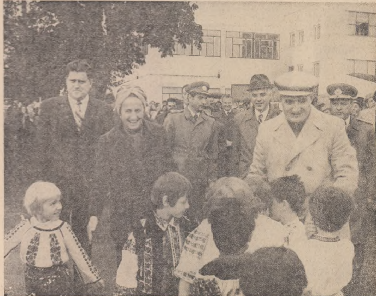
(Continuare în pag. a III-a)