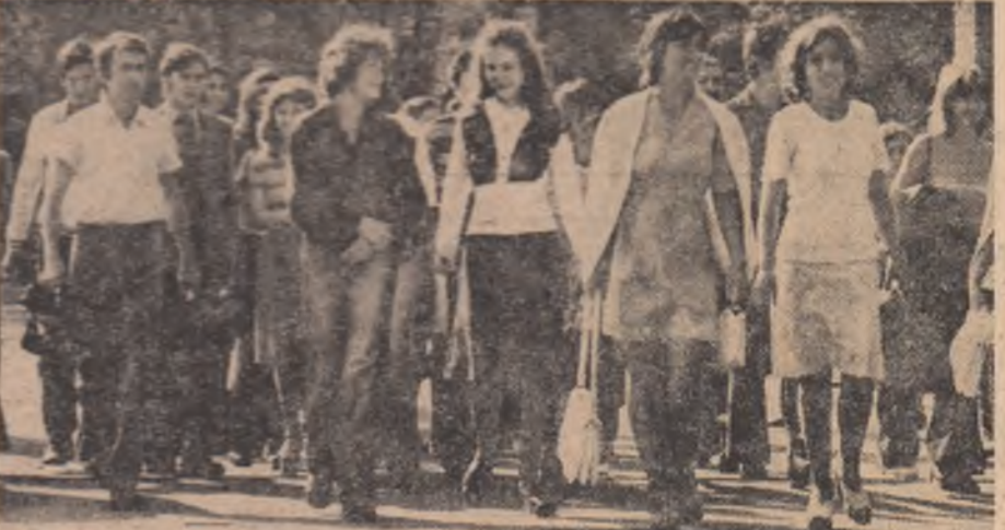
TINERII DE AZI, AȘA CUM SÎNT EI, AȘA CUM ÎI RECOMANDĂ MUNCA LOR (pag. a III-a)

A fi comunist, spune secretarul general al partidului tovarășul Nicolae Ceaușescu, înseamnă a lucra mereu mai bine și mai conștient, pentru întrecerea planului de muncă și activități de plan, a servii cauza patriei, a socializării, a patriei, în orice împrejurare.