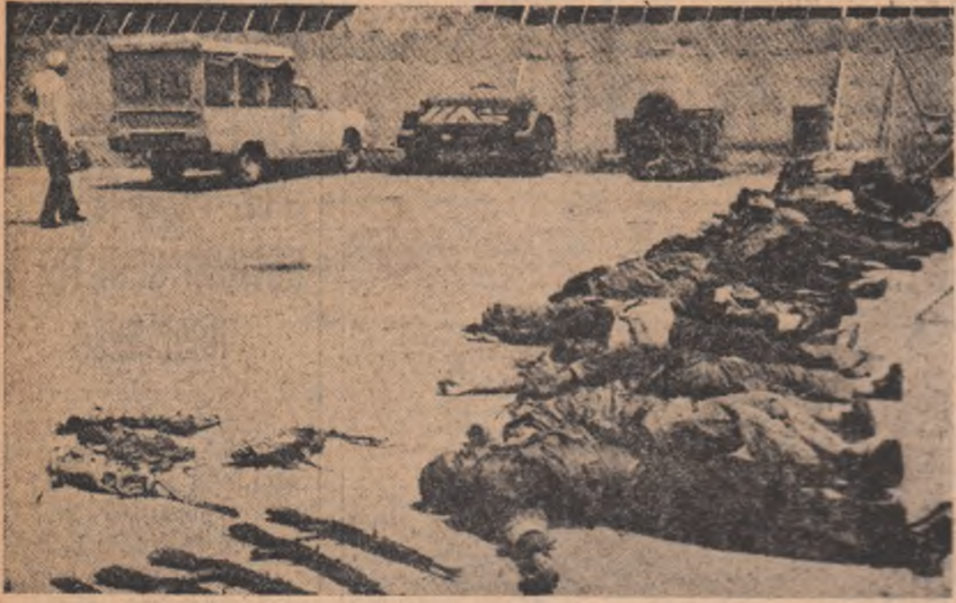
RHODESIA: Prin farsa recentelor „alegeri”, Ian Smith s-a hotărât să urmărească o așa-zisă „soluție internă”. Ce înseamnă această „soluție” în practică se poate vedea în fotografia de mai sus

STIRI, NOTE, COMENTARII • STIRI, NOTE, COMENTARII • STIRI, NOTE, COMENTARII • STIRI, NOTE, COMENTARII