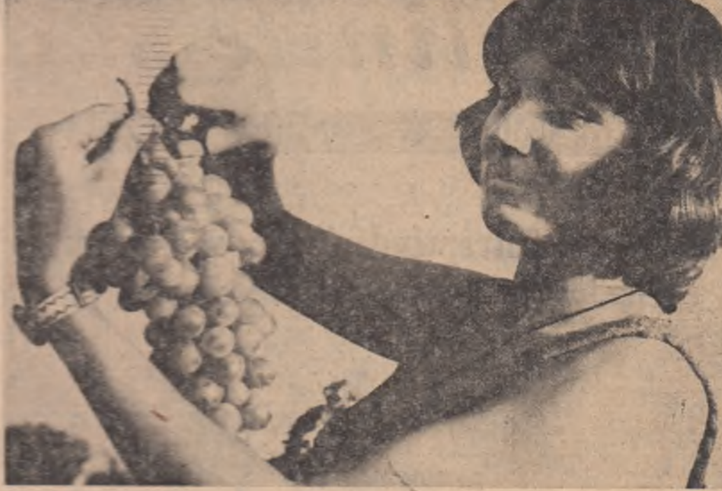
Mîini harnice pentru o toamnă bogată.

Eforturile depuse în cursul primăverii și verii sînt răsplătite din plin acum NICI UN BOB DIN BOGĂȚIA TOAMNEI SĂ NU RĂMÎNĂ PE CÎMP