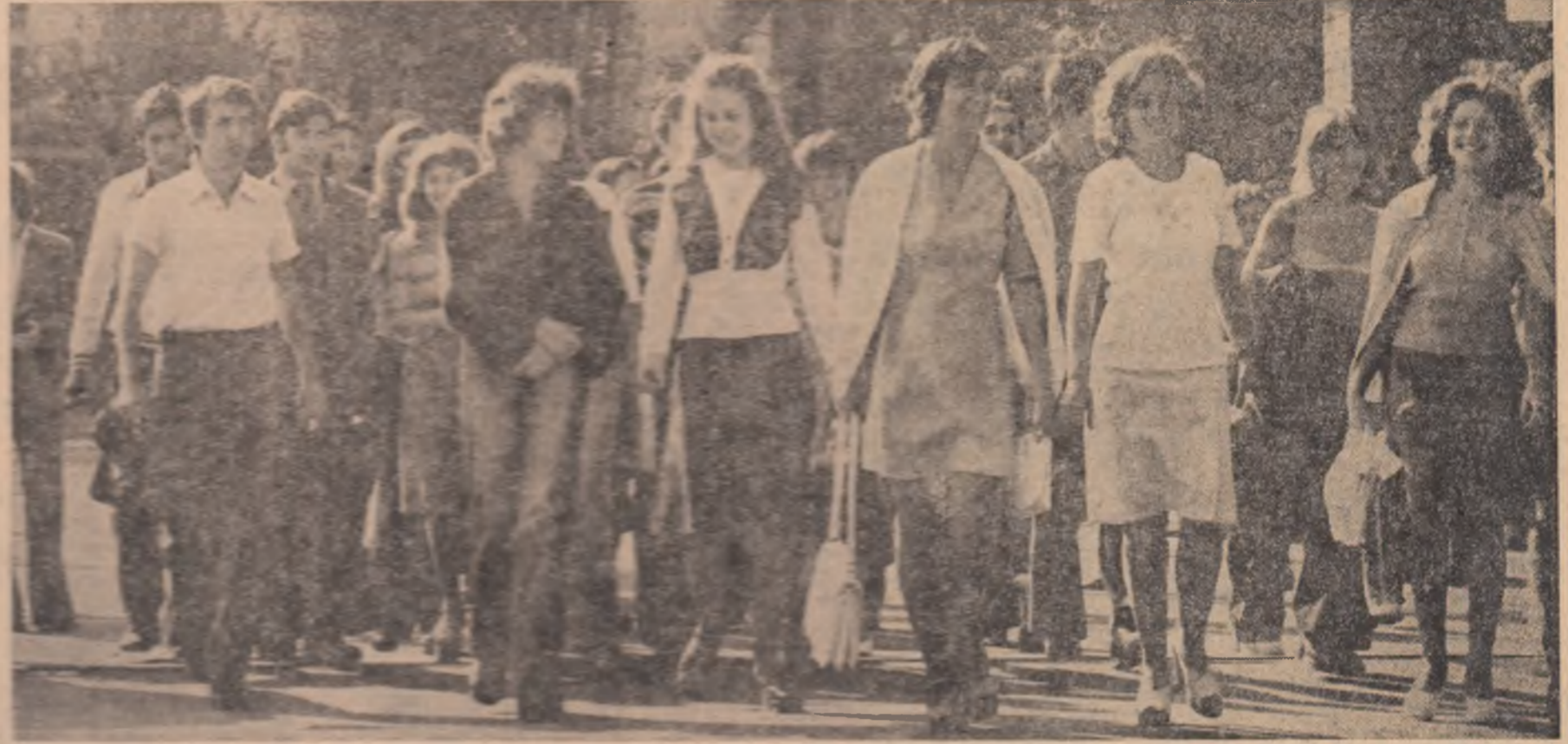
„Nobila neodihnă de a sti“

de libertate, seles de cunoaștere, receptivitate la nou, gândire creatoare. Ar trebui omnia, opoi, omnia și specialitate, curaj și sinceritate, spiritul învigorant, de acțiune și afirmare, deplină amănunțire cu cel mediativ, filosofic. În același timp este relevant faptul că aceste meșteșuguri, de unde s-au ridicat Eminescu și Coșbuc și Arghezi, Grigorescu și Brăncuși, Enescu și Tuceanovici, alcătuiesc un adevărat tezaur al Păcii. Tineretul (doar în falnicul nostru) este și ea o altă înșirare, specifică. Și de la un capăt la celălalt al istoriei românilor, ca un fir îndesat și pentru totdeauna — patrimoniu. Societatea noastră socialistă — o omul liber și stăpîn pe propria destin — o ridică toate aceste virtuți la rangul de steme, înobilându-le cu stăruința noi, revalorizându-le din nou în condiții noi și cîștind, sintaxa în. Căci principii și normele muncii și vieții comuniste, ale eticii și echității socialiste — sînt la baza omnei opere de educație comunistă a tinerilor, de formare a omului nou. Cum înțeleg și sint lucruri noi și răspund exigențelor acestui nou, să-i organizăm viața și munca în spiritul comunist — tot în toate întrebările și răspunsurile completelor, firesc și necesar, ținem această reportaj-oncheta.