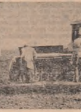
Seamănatul cerealelor de toamnă la C.A.P. Petroșani, județul Buzău, se desfășoară conform graficelor...