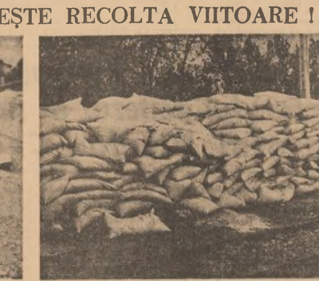
Pe rampa Stației C.F.R. Ulmeni, județul Buzău, se află de aproape o lună de zile 200 tone de îngrășăminte cu azotat de amoniu și superfosfat pe care beneficiarii, I.A.S. Sîlpu, n-a binevoit să le ridice nici pînă în ziua de azi...