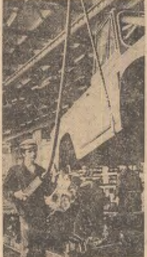
In hala de montaj general a întreprinderii mecanice din Cimpungu Muscel