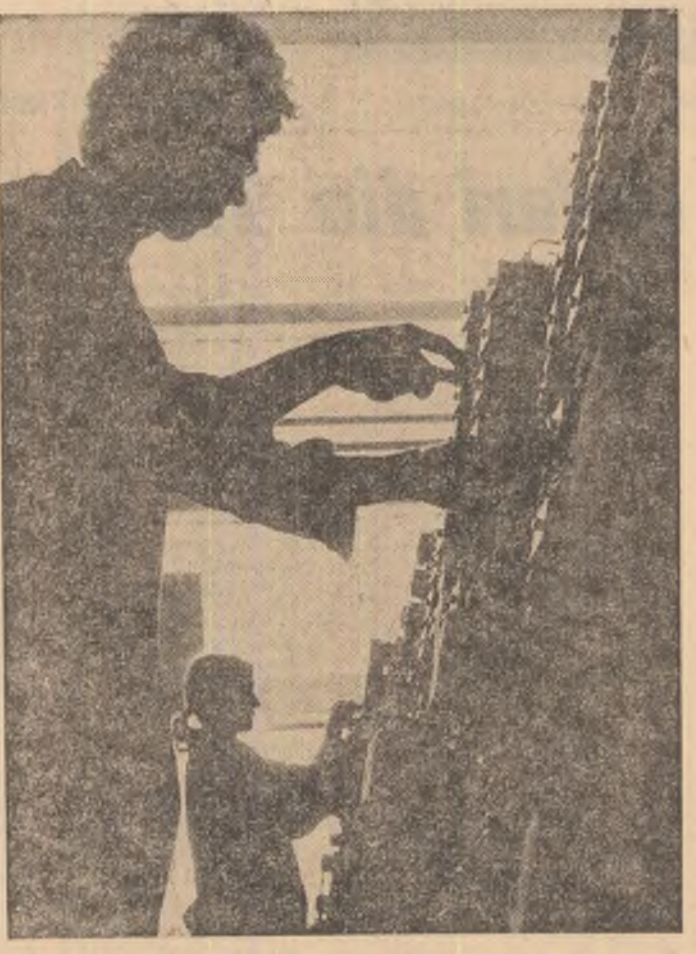
MIINI INDEMNITATE. (La întreprinderea de panouri și tablouri electrice — Alexandria)

La Combinatul siderurgic Reșița, s-au extins în producție noi și eficiente metode de elaborare a metalului, menite să asigure utilizarea, cu randament mărit a agregatelor cu flux continuu și reducerea consumurilor specifice pe fiecare tonă de produs. Măsurile întreprinse în acest an, pentru aplicarea de noi soluții tehnice în producția de metal, ca și extinderea celor mai valoroase inițiative muncitorești, ce au vizat ridicarea productivității muncii și a indicilor de utilizare a agregatelor cu flux continuu, s-au materializat în importante sporuri la toate produsele realizate de combinat. Astfel, furnaștii oțelării și laminatorii, au elaborat până acum, peste prevederile planului, „la zi” pe 1977, mai mult de 50.000 tone fontă, oțel și laminate finite.