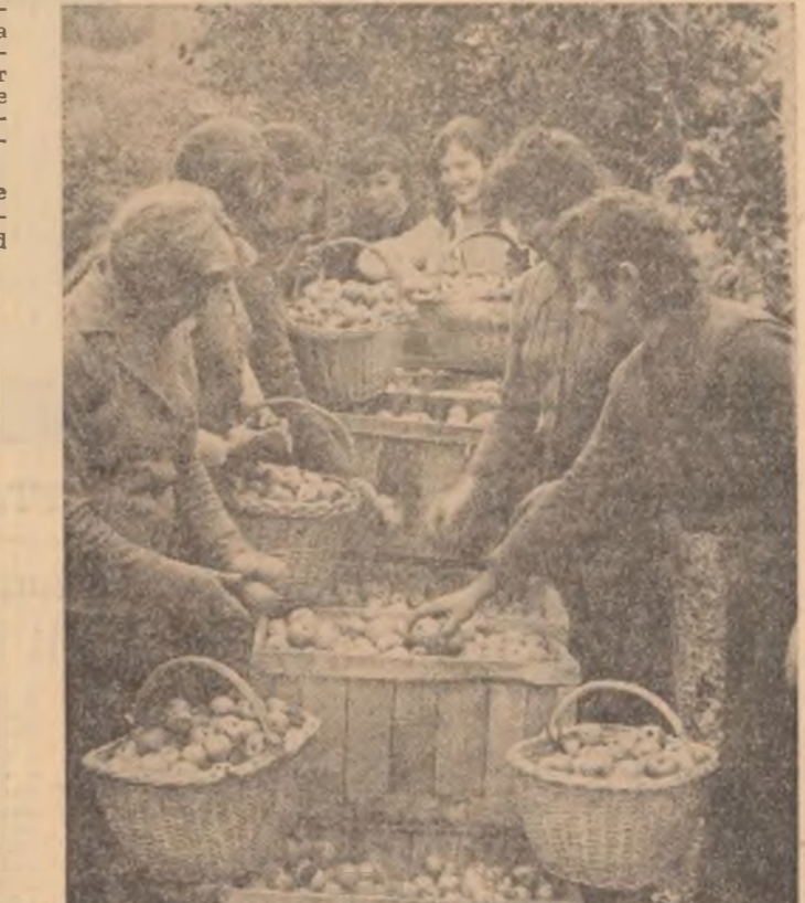
AL. BALGĂDEAN (Continuare în pag. a V-a)

Din păcate, însă, nu peste tot întinlim astfel de situații. La C.A.P. Bacia, Spini, Totești ș.a.