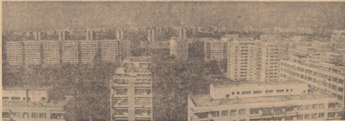
Un „micro-oras” din... Capitală: Cartierul Titan

Celelalte estimative arată că prin utilizarea în continuare cu maximum de randament a capacităților din dotare și prin folosirea rațională a materialelor prime și materialelor, pînă la 31 octombrie, în județul Suceava se va obține un spor valoric de producție de circa 400 milioane lei, în condițiile creșterii productivității muncii, peste prevederile de plan ale perioadei.