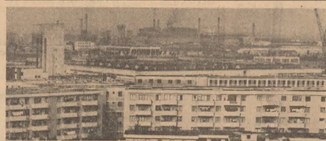
Slatina, astăzi

Marți, 25 octombrie, președintele Republicii Socialiste România, tovarășul Nicolae Ceaușescu, a primit pe ambasadorul Republicii Populare Bangladesh, Rashid Ahmad, în vizită de rămas bun, la încheierea misiunii sale în România.