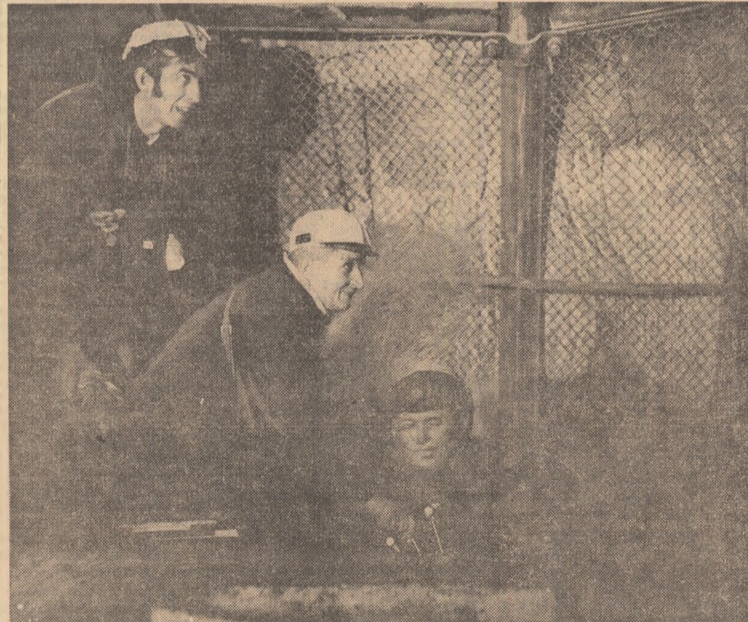
La Întreprinderea minieră Vulcan, tovarășul Nicolae Ceaușescu a preluat pentru un timp comanda unei combine

Cu prilejul vizitei de lucru în județul Hunedoara a tovarășului Nicolae Ceaușescu, secretar general al Partidului Comunist Român, președintele Republicii Socialiste România, posturile noastre de radio și televiziune vor transmite, direct, astăzi, în jurul orei 11,30, adunarea populară din municipiul Hunedoara