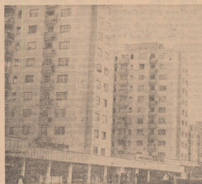
Cartierul Mândăștur din Cluj-Napoca