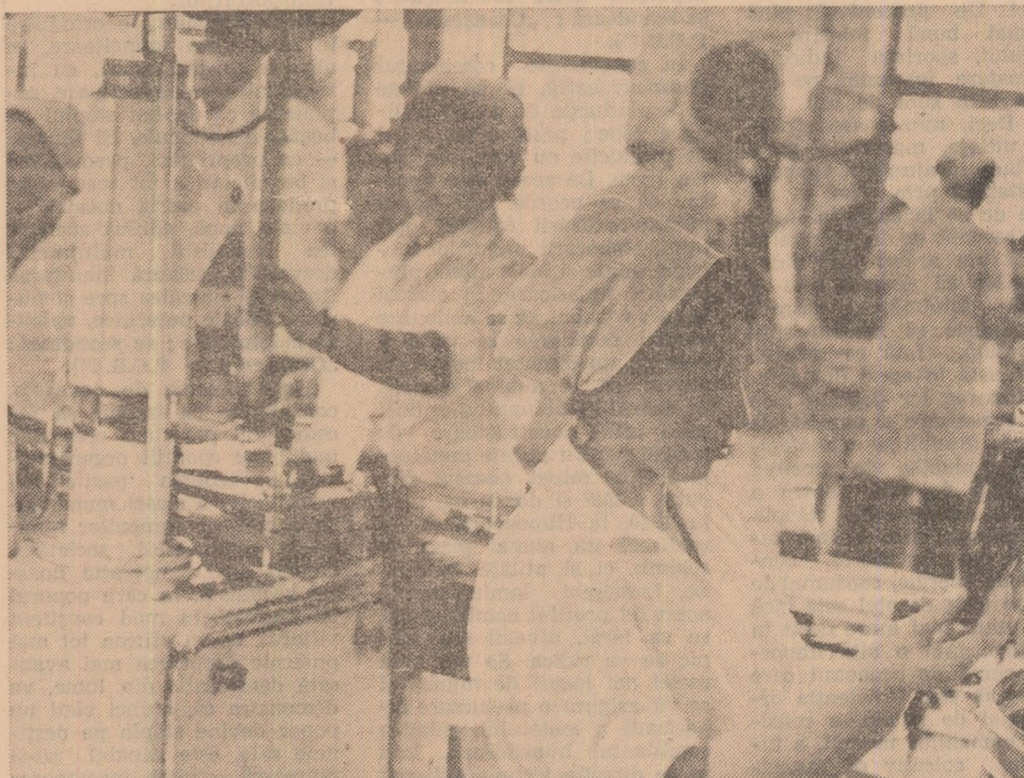
În hala de producție a întreprinderii de băuturi răcoritoare din Piatra Neamț