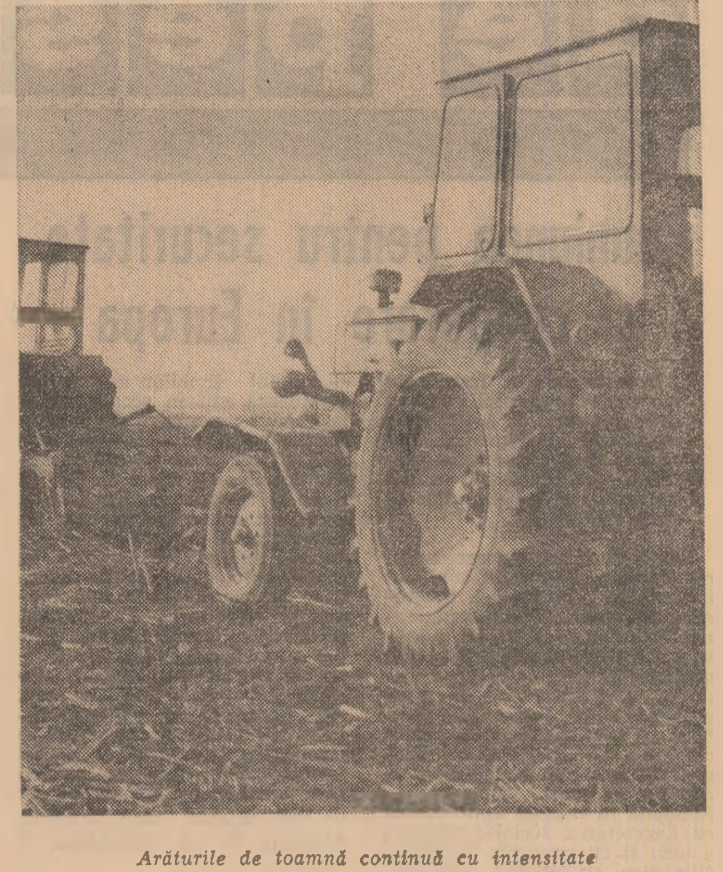
Arăturile de toamnă continuă cu intensitate