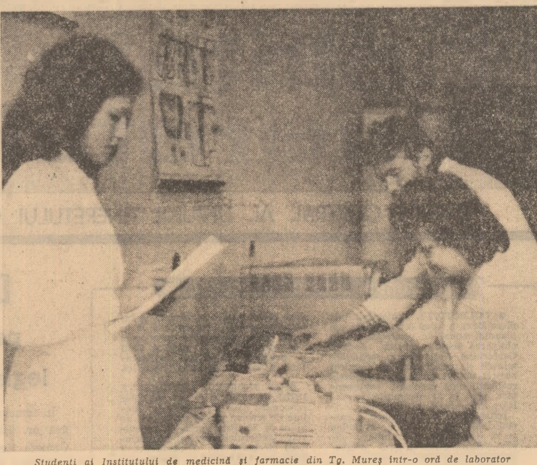
Studentii ai Institutului de medicină și farmacie din Tg. Mureș într-o oră de laborator

Comentind diferite și unori contradictorii opinii ale criticii, analizind textul dantesc și transpunerea lui, botticelliană, în imagini, studiul urmărește, astfel, paralel, evenimente sociale, idei și concepții artistice, explicînd aportul original al unei creații aparent simple, dar deosebit de subtile, de vibrante. Referin-