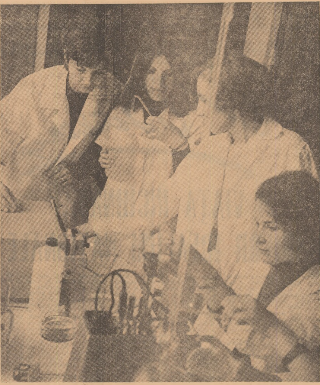
O imagine obișnuită de muncă într-unul din laboratoarele Combinatului de fibre sintetice din Săvinești