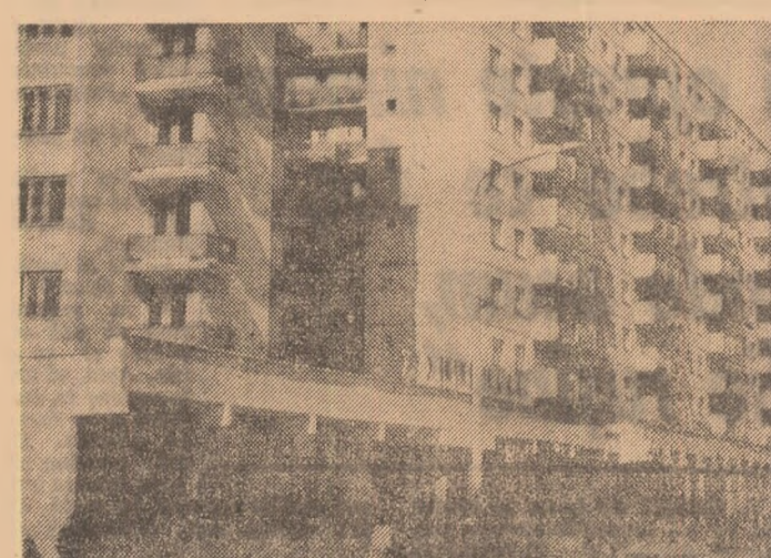
Construcția noi pe bulevardul Gheorghe Doja din Zalău

(Urmare din pag. 1) dezvoltăm armonios la Zalău și în tot județul, incit să aducă un spor de frumusețe acestor străvechi meleaguri. Vom avea nevoie de încă 17.000 locuri noi de muncă în meseriile: siderurgie, chimie, operatorie, țesături, filatură, țrefabri, construcții de mașini, construcții industriale și civile. Alți 17.000 de tineri vor fi pregătiți să învețe a manevra mașini și utilaje moderne, să supravegheze procese chimice, să elaboreze șarje de fontă și oțel. Industrie și civilizație. Acesta este senalul eforturilor noastre. Ne se pot naște fabrici, uzine și mari întreprinderi fără școli, fără doțori corepunzători, fără instituțiile timpului liber în care muncitorii își petrec în mod instructiv și creativ timpul său liber, după efortul de muncă. Casa de cultură și cinematograful modern recent construite vor fi completate cu o sală de sport „polivalentă”, o bibliotecă publică, un spital modern cu 720 paturi și o policlinică, noi spații comerciale și încă 6.000 de apartamente ce vor fi gata până la sfârșitul cincinalului.