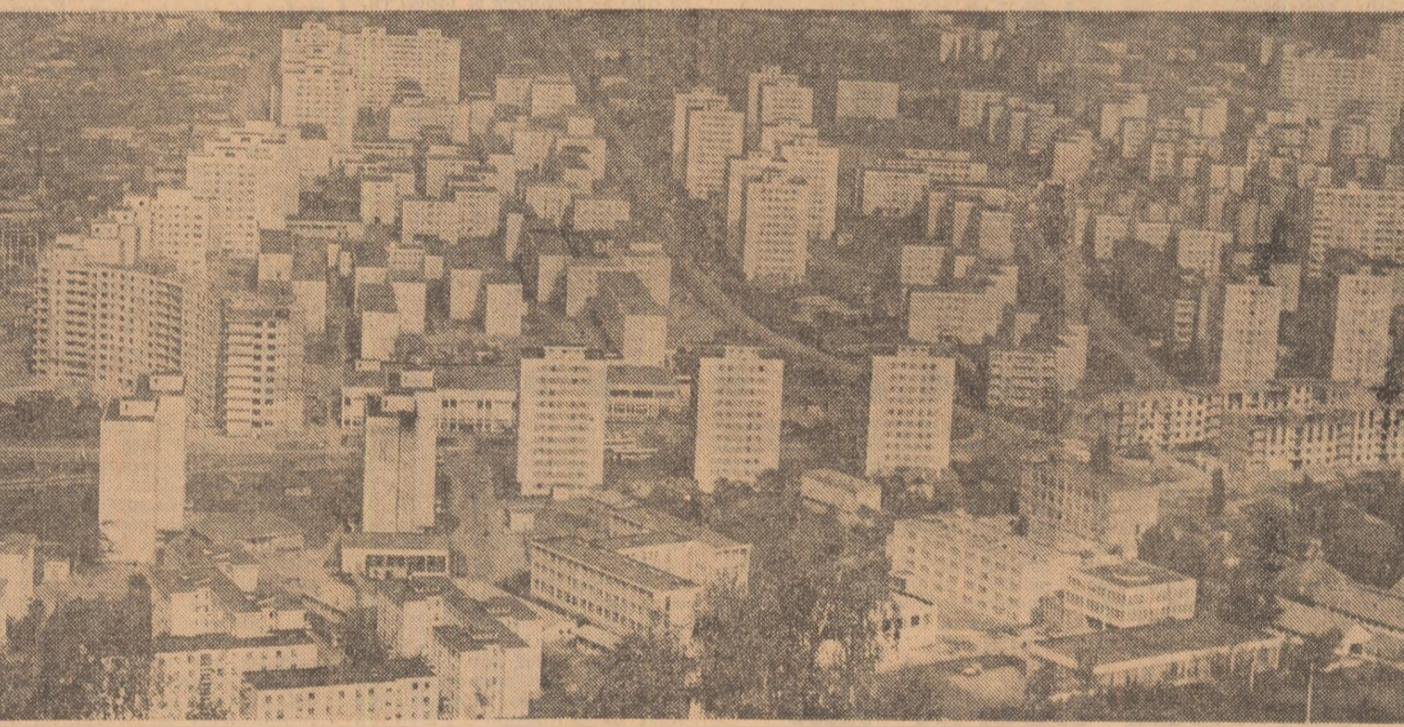
Plata Neamț — pe teritoriile anulate în 1977 (noul cartier Dărmănești)