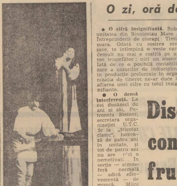
Scenă din spectacolul „1907”, după Dominic Stancu, prezentat de Teatrul dramatic „Al. Davila” din Pitești