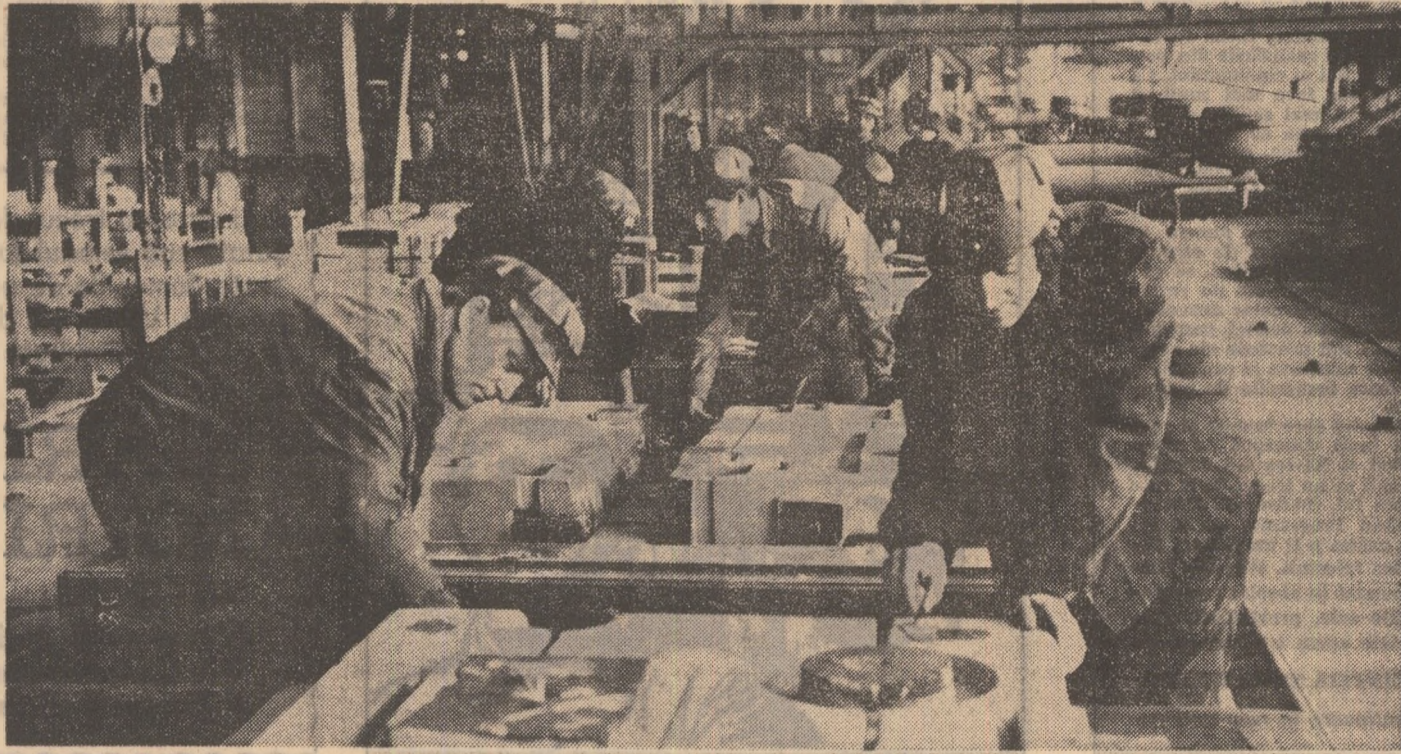
Investițiile rodesc ritmic în noi capacități de producție

● În timpul pe care l-am parcurs în acest cincinal au intrat în funcțiune peste 800 capacități productive importante. ● În cursul anului 1978 se vor pune în funcțiune alte 665 capacități de producție mai importante, din care 610 industriale și 55 agrozootehnice. ● Ca urmare a politicii de dezvoltare armonioasă a forțelor de producție, numărul județelor cu o producție industrială de cel puțin 10 miliarde a ajuns la începutul acestui an la 23, cu două mai multe decât în 1975.