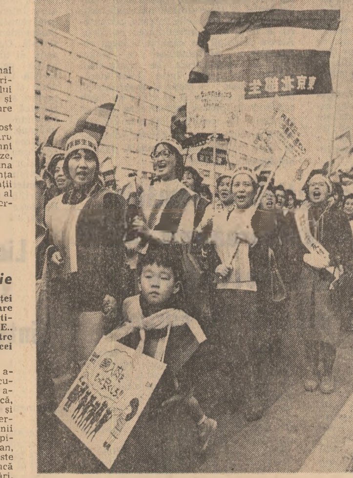
JAPONIA — Demonstrație la Tokio pentru ameliorarea condițiilor de viață și muncă ale locuitorilor niponi

După cum informează agenția siriacă de informații S.A.N.A., citată de agenția France Presse, președintele Siriei, Hafez Al Assad, și suveranul iordanian au avut o convorbire. Pe de altă parte, primul ministru sirian, Abdul Rahman Khelefi, a conferit cu omologul său iordanian, Mudar Badran.