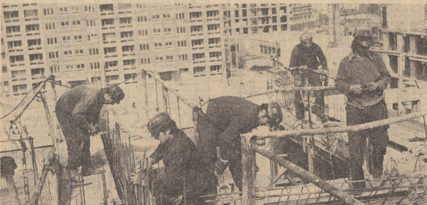
„Mai repede și mai bine” este deviza constructorilor pentru ca în condiții de confort sporit și în cât mai scurt timp, noile apartamente să-și primească locatarii.

Muncim din ce în ce mai bine și ritmurile producției sînt în continuă creștere, potențialul economic valorificat tot mai superior, sporindu-ne cu fiecare zi avuția națională ale cărei efecte le resimțim direct în ridicarea nivelului de trai, economiei noastre socialiste și mai puternică, sublinia tovarășul Nicolae Ceaușescu — că în toți acești ani clasa noastră muncitoare a demonstrat prin fapte să știe să conducă mai bine decât clasele exploatare, că-și îndeplinește în mod minunat misiunea de răspundere pe care și-a asumat-o în fata întregului popor. Inuși faptul că în cadrul Conferinței Naționale a partidului a fost aprobat Programul privind măsurile suplimentare de dezvoltare a României pînă în 1980 dovedește — că stă în puterea clasei noastre muncitoare să detecteze noi și importante rezerve ale economiei, să își asume angajamente de mare răspundere conștient, astfel, perspectiva dezvoltării