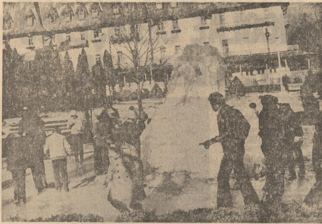
DEBATA DE LA BAZA A FIECĂRUIA

UN SINGUR STRUNG, CARE FUNCȚIONEAZĂ ÎN GOL TIMP DE O LUNĂ CÎTE 10 MINUTE PE ZI, CONSUMĂ ÎNUTIL 30 KWH, CANTITATE DE ENERGIE PENTRU PRODUCEREA CĂREIA SÎNT NECESARE 45 KG LIGNIT SAU 840 GRAME PĂCURĂ SAU 9,6 M.C. GAZ METAN