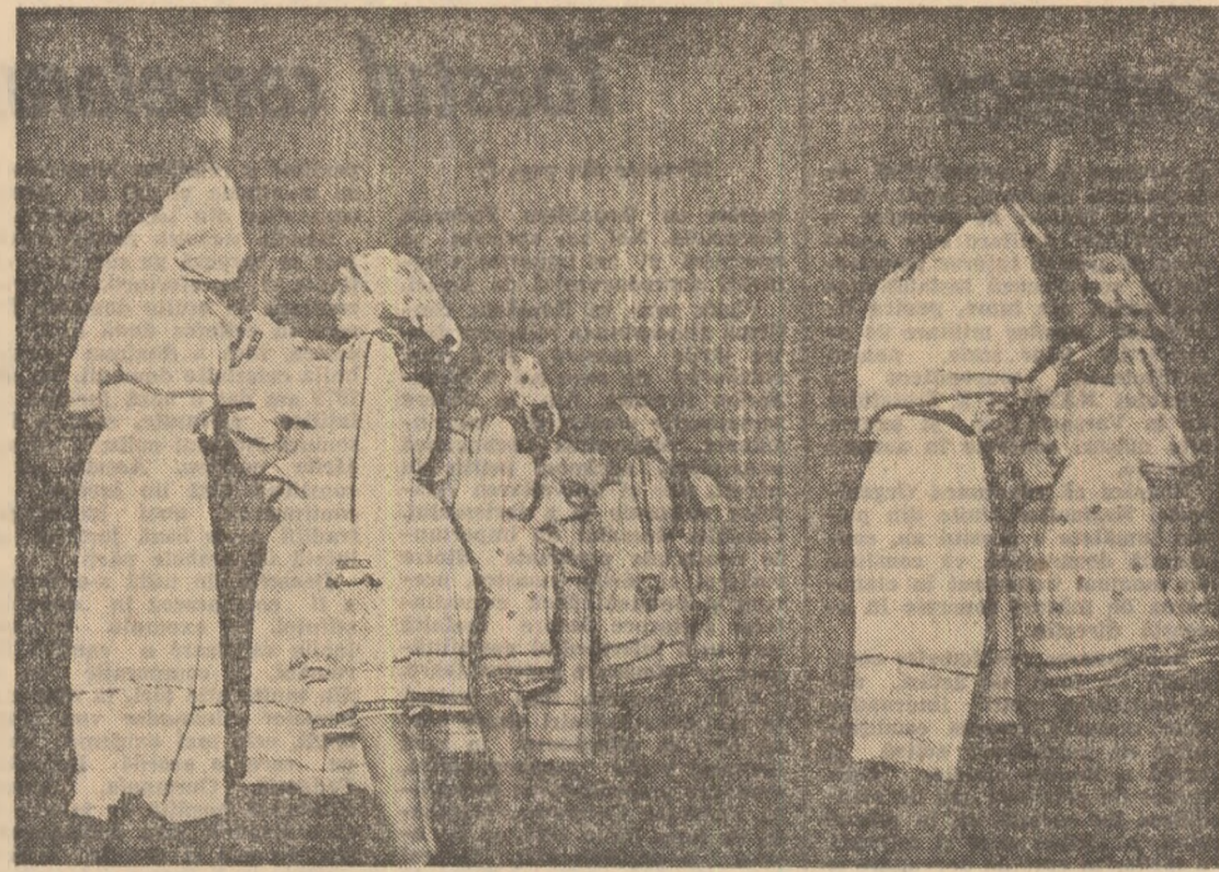
Echipe de dansuri a Facultății de agronomie din București, participanți la cea de-a 2-a ediție a Festivalului „Cîntarea României”

nizate la finalul activității taberei naționale cu un pronunțat caracter de participativitate, la care a avut loc la Oțelul Roșu, ne-am dat încă o dată seama că pe lângă audiența filmului de amatori, și pe lângă succesele sale incontestabile, mai persistă o sensă de deficiență, cu preponderență subiective. Înainte de a le aminti, să notăm că, în comparație cu 4-5 ani în urmă, baza materială a cinematurilor s-a îmbunătățit substanțial. În momentul de față, în dotarea lor se află peste 2000 de aparate de filmat pe 8, super 8 și 16 mm. Cu mirare am aflat însă că doar ceva mai mult de 500