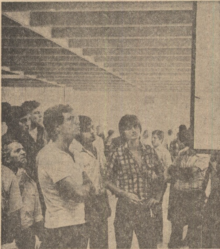
ITALIA. Citiți din cei peste un milion de tineri șomeri italieni așteptând o iluzorie slujbă într-unul din birourile de plasare a forței de muncă