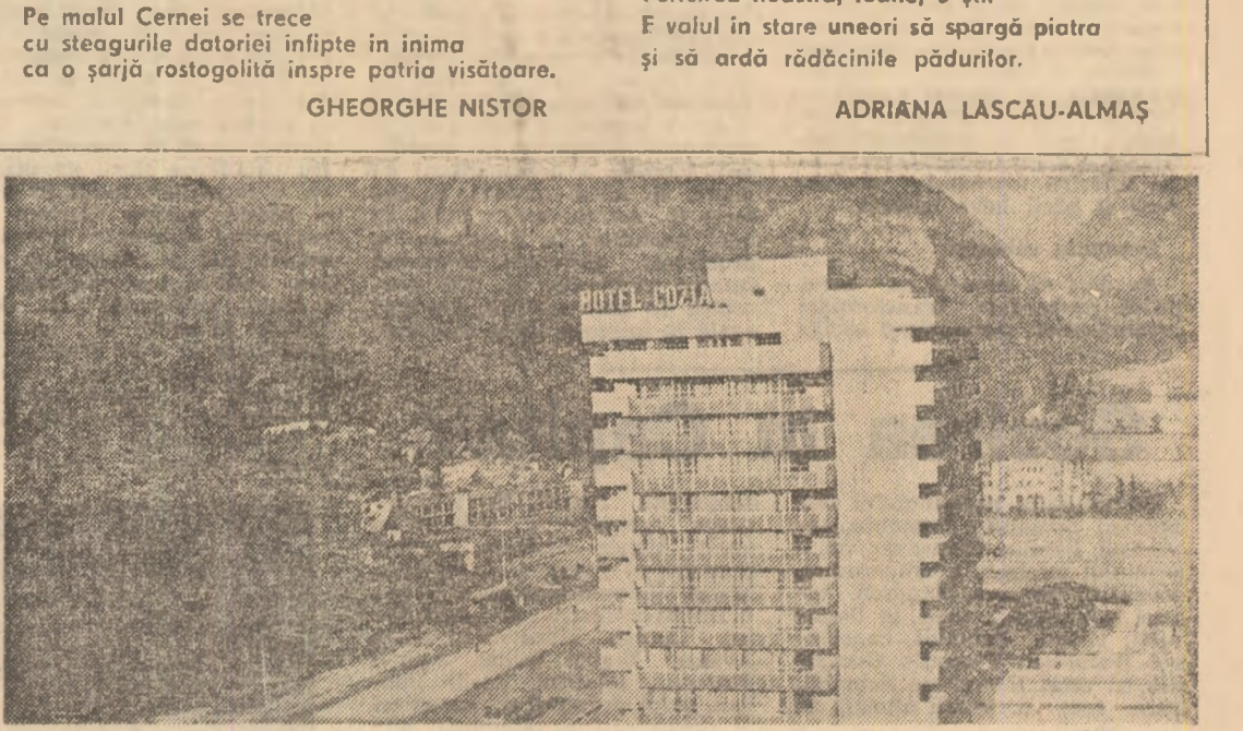
Ilustrată din Stațiunea Căcăluta