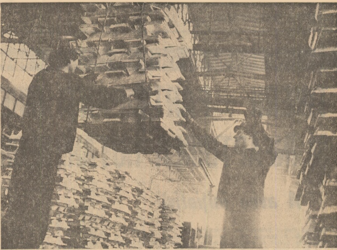
Oamenii metalului alb