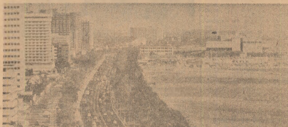
Filipine. Imagine din Manila