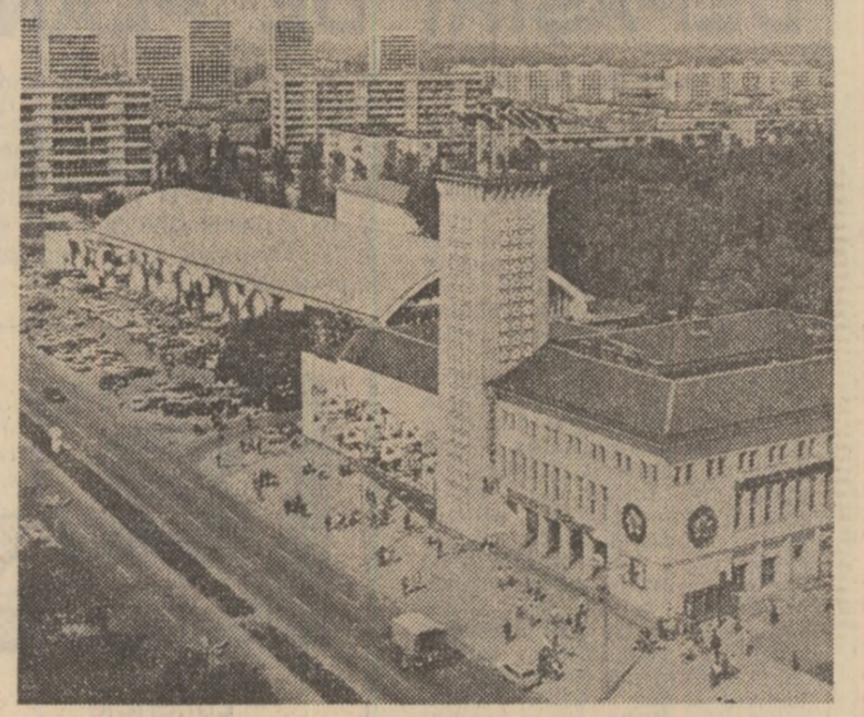
R. P. BULGARIA. Imagine din Plovdiv

Sosit luni la Atena, secretarul general al O.N.U., Kurt Waldheim, a declarat presei că, în urma vizitelor pe care le-a făcut la Ankara și Nicosia, există șanse de progres în negocierile privind reglementarea