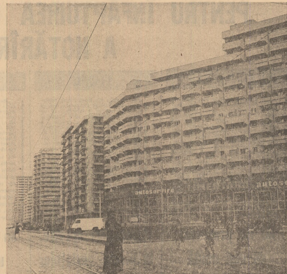
Din noul peisaj al Capitalei: cartierul Pantelimon

noastră. Cu acest prilej, a avut loc o convorbire, care s-a desfășurat într-o atmosferă cordială.