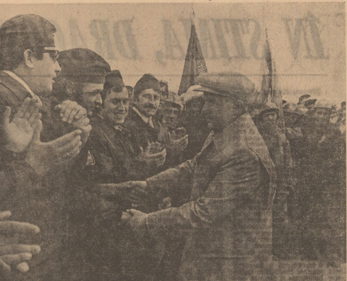
27 mai 1977. Brigadierii Santerului național al tineretului Canalul Dunăre — Marea Neagră li înconjoară cu entuziasm și cu nefermărită dragoste și stimă pe secretarul general al partidului

Întreaga activitate a organizației este orientată spre formarea conștiinței politice și ideologice a tineretului, spre educarea lui în spiritul valorilor politice și morale ale socialismului. Activitatea este organizată în jurul sarcinilor de bază care stau la baza construcției socialiste.