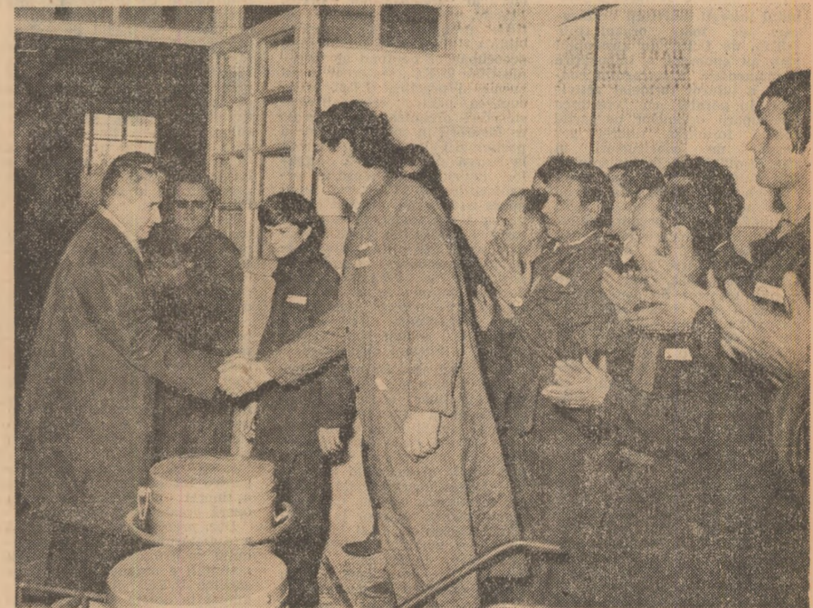
Pe platforma Măgurele, profundă grațitudine exprimată tovarășului Nicolae Ceaușescu pentru condițiile minunate de muncă, învățare și cercetare create pentru tineri și cadre didactice în acest adevărat „combinat“ al științei și tehnicii românești

lucra direct în producție, ca muncitorii, drum pe care și-l înțelegere superioară a muncii, iar dacă vom opta pentru cercetare, o vom face știind de la jragădă vîrstă eficiența și sensul muncii științifice“.