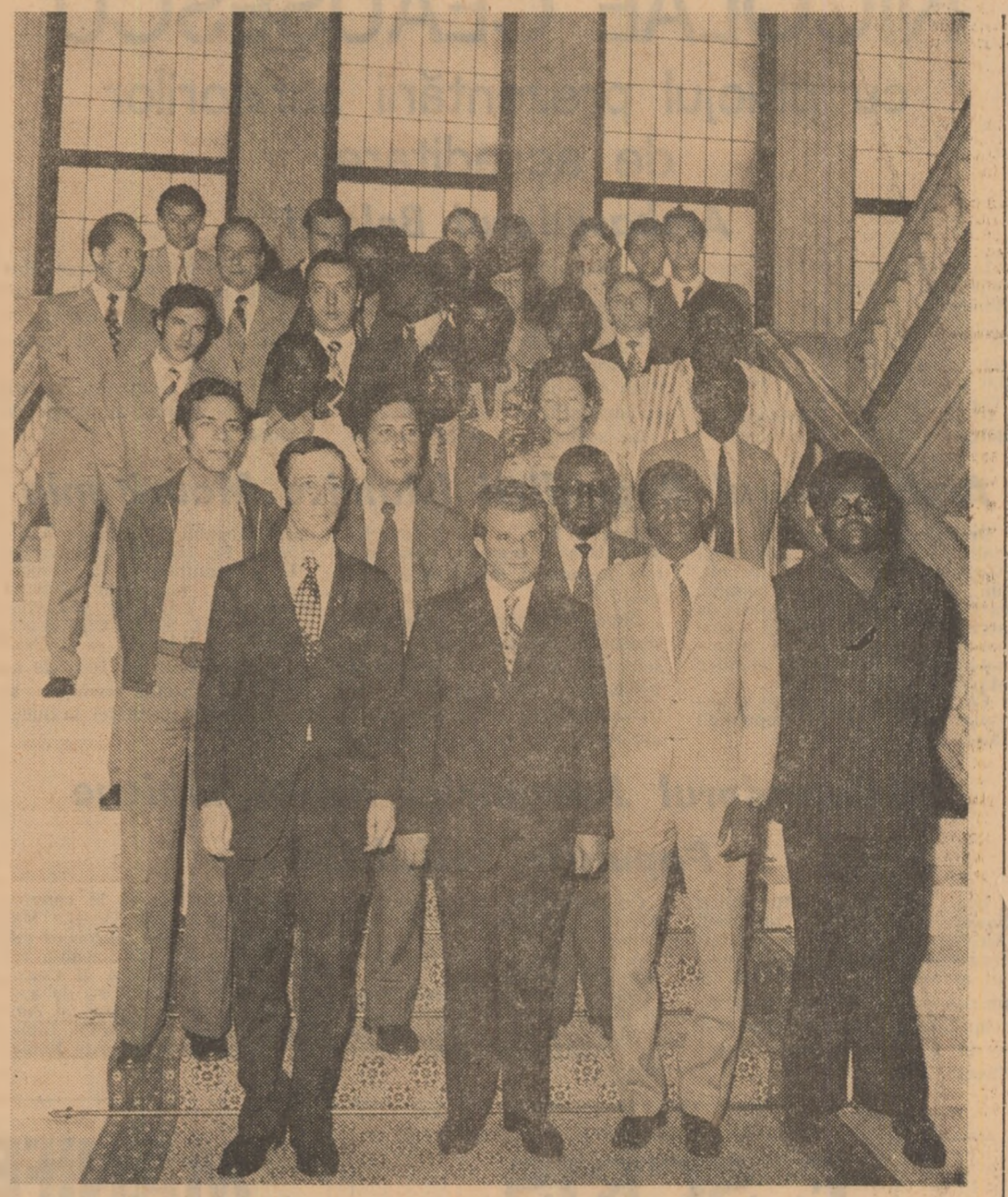
După primirea participanților la seminarul bilateral U.T.C. — Mișcarea Panaficană a Tineretului

Concepția României socialiste cu privire la instaurarea unei noi ordini economice mondiale se găsește, în mod strălucit, în acțiunea sa practică pe plan internațional, îndreptată în mod special spre transparența în viață a acestui concept înaintat pe care îl promovază cu hotărâre.