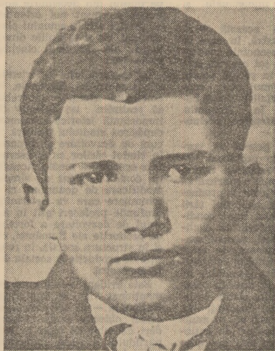
„Sînt fiu credincios al poporului meu și-i știu și durerea și vreea”

rului Nicolae Ceaușescu dobîndea contururi tot mai luminoase. Documentele vremii menționează că în 1936 lucra ca secretar al Comitetului regional Prahova al U.T.C. Aici a desfășurat o activitate bogată, a participat direct la numeroase acțiuni ilegale, a condus lupta tinerilor din Prahova pentru drepturi economice și politice, a militat pentru ca tot mai mulți tineri să cunoască și să urmeze cuvîntul partidului comunist. Siguranța l-a urmărit