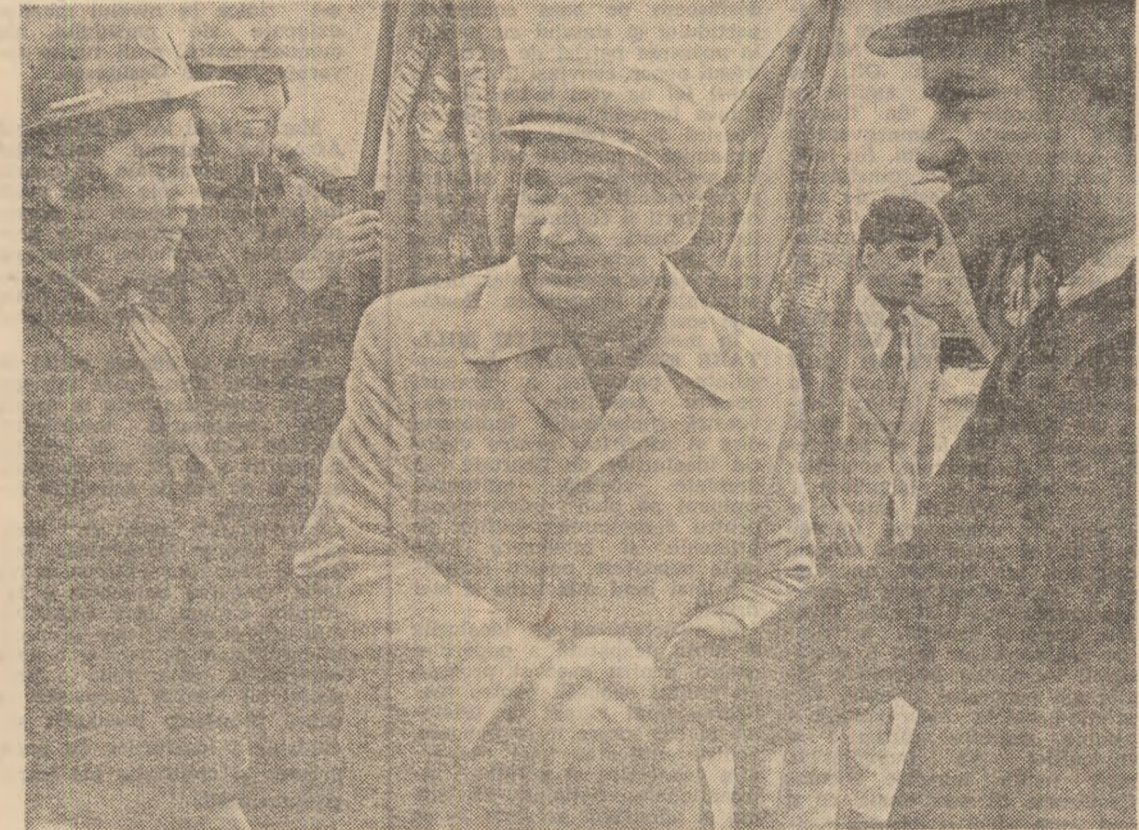
„Tineretul reprezintă schimbul de mine; lui îi revine sarcina de a asigura mersul înainte al patriei noastre spre comunism”.

devine în acest fel pentru tineri o experiență de viață, o experiență care încorporează munca lor în cadrul societății, ocupările lor pentru continua perfecționare a pregătirii profesionale, pentru lărgirea orizontului de cunoștințe. Mari îndatoriri revin și factorilor care răspund de educarea tinerilor, care trebuie să-și pregătească în așa fel încît să fie în stare să descopere cu „ochii prezentului” direcțiile de dezvoltare a viitorului și să analizeze activitatea lor, munca lor în prezent cu „ochii viitorului”.