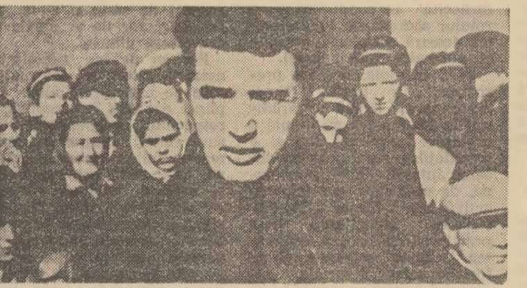
„O Romînie cu adevărat democratică nu poate să neglijeze tineretul”