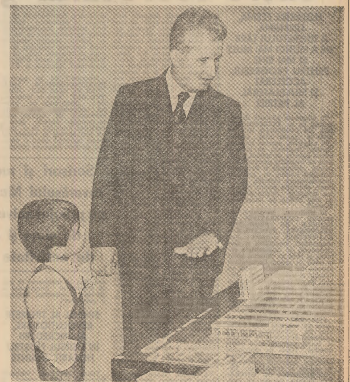
„Avem cu toții o mare răspundere — de felul cum îndrumăm tineretul depinde viitorul patriei noastre, dezvoltarea ei, bunăstarea și independența poporului”

care le trăiesc. Astăzi ei verifică în practica economico-socială cunoștințele aflate din cărți. Integrarea învățămîntului cu producția pentru cei din școli și din facultăți, educarea prin muncă și pentru muncă, pentru toate categoriile de tineri, le oferă posibilitatea să interpreteze singuri fenomenele și procesele sociale, să-și formeze o bogată experiență de viață. De pe această poziție și învestigarea viitorului se face cu mijloace eficiente. Tovarășul Nicolae Ceaușescu cere organizațiilor U.T.C. să-i ajute pe tineri să cunoască viitorul, penitru a-i orienta pe drumul vieții,