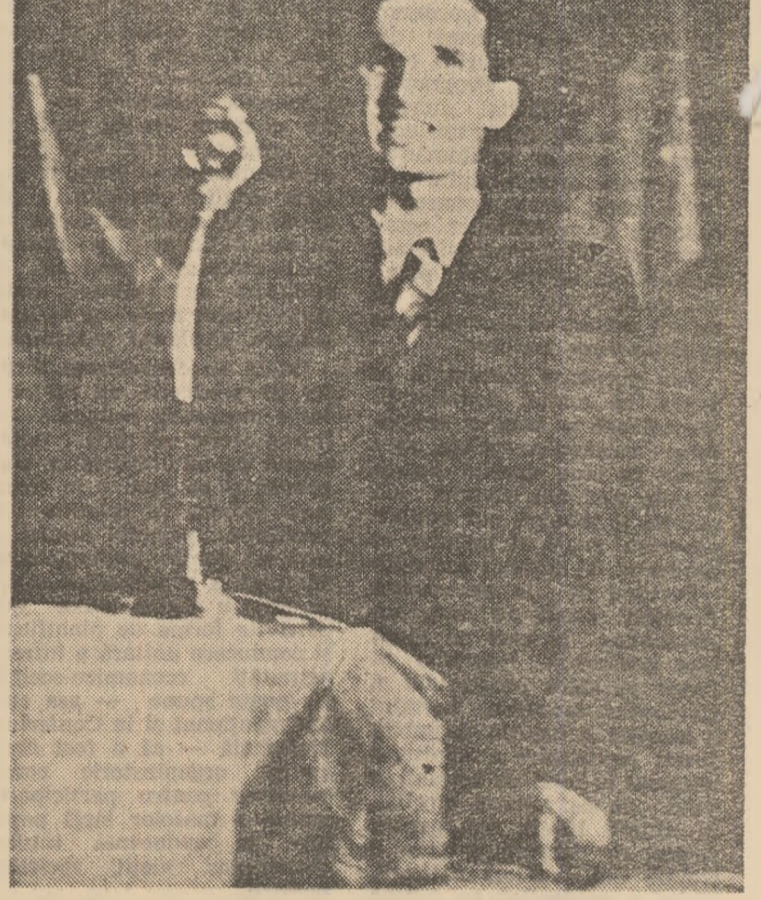
„Prin munca noastră să refacem țara. Prin munca noastră să contribuim la clădirea unei Romîni îmbelșugate și frumoase, cum n-a fost niciodată pînă acum”