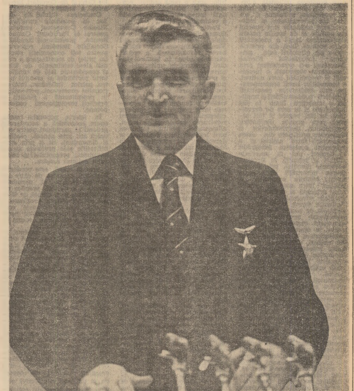
„Mă adresez tinerilor comunisti, întregului tineret cu chemarea: dragi tovarăși și prieteni tineri, faceți totul pentru a vă însuși cele mai noi cunoștințe din toate domeniile de activitate. Învățați, munciiți și învățați pentru a deveni buni muncitori, buni specialiști, cetățeni demni ai patriei noastre socialiste, pentru a vă putea îndeplini în cele mai bune condiții sarcinile ce vă revin”

spiritului novator al tineretului generației”. Din sublinierile de mai sus se desprinde ideea că generozitatea față de tineri se împletește cu o accentuată exigență. Și este firesc să fie așa. Dealtfel, politica față de tineret, îndrumarea, exigența, grija cu care este înconjurat corespund concepției partidului, a secretarului său general, în legătură cu