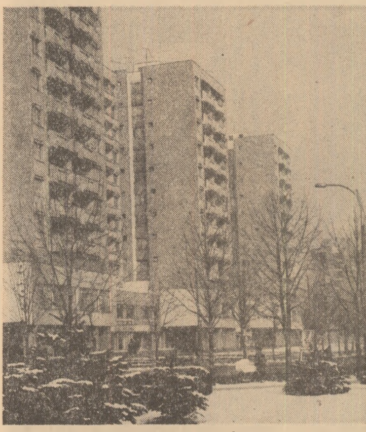
Construcții noi la Hunedoara