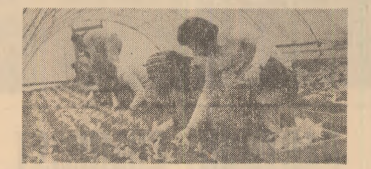
Plantatul răsădului de salată în solarii încălzite ale Institutului agronomic bucureștean.