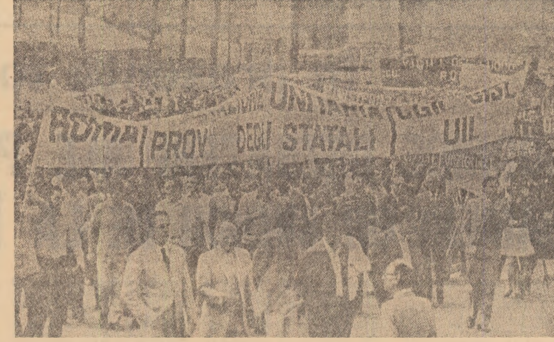
ITALIA — Demonstrație desfășurată la Roma în sprijinul adoptării unor măsuri de combatere a șomajului

Nu există nici un fel de „criză” în relațiile dintre Statele Unite și Israel, chiar dacă cele două țări au deosebite păreri — a afirmat, la rândul său, purtătorul de cuvânt al Departamentului de Stat.