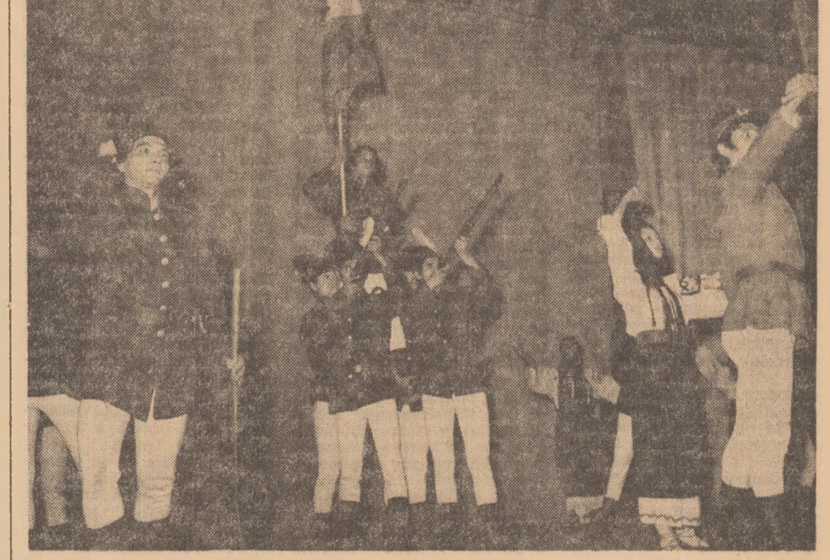
„Independența” — dans tematic în interpretarea Ansamblului artistic al C.C. al U.T.C.

ne diminundăm forța polemică cînd este vorba de impozituri, oportunități, demagogie, autumulțumire. Iubim cu toții teatrul dar nu oțugăm doar să-l iubim, ci trebuie să-l apărăm de piesele nule, fără o mîză etică superioară, fără o angajare totală în slujba unor idealuri supreme ale epocii în care trăim. Personajele textelor noastre dramatice, eroii ce au viață de sine stătătoare, ridică întotdeauna