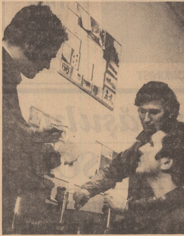
In laboratorul de încercări tehnologice se învață și se face cercetare științifică...

Dimineața, intrarea în treburile de cercetări și proiectări pentru automobile și tractoare — „platforma” viitorilor specialiști de autovehicule, într-o secție a CPL-ului — „platforma” studenților de la industrializarea lemnelor la Tractorul „platforma” celor de la mecanică agricolă, la Săcele și Centrul de calcul din Brașov — „platforme” electroniștilor, la ocolul silvic — „platforma” viitorilor silvicultori. În toate aceste unități de integrare, cursurile, seminariile, practica, orele de laborator sint subordonate necesităților de azi ale uzinei sau institutului și, în mare măsură, perspectivei de dezvoltare ale unei ramuri pentru care se pregătesc studenții.