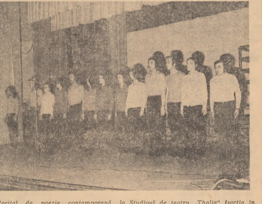
Recital de poezie contemporană la Studioul de teatru „Thalia” (secția în limba germană)

Nu există, poate, satisfacție mai mare pentru un om decît aceea pe care i-o dă sentimentul ce-l încearcă revărsat, dacă nu printr-o vechiă laborator, în orice caz prin locurile de care s-a legat pe viață prin strădania, frămîntări și uncoară amărăciuni chiar, pentru ca într-o zi să trebulască a se desprinde, volens-nolens, de ele. Scriu aceste rânduri de aceea, ca într-un jurnal intim, după ce în două rînduri, la sfir-