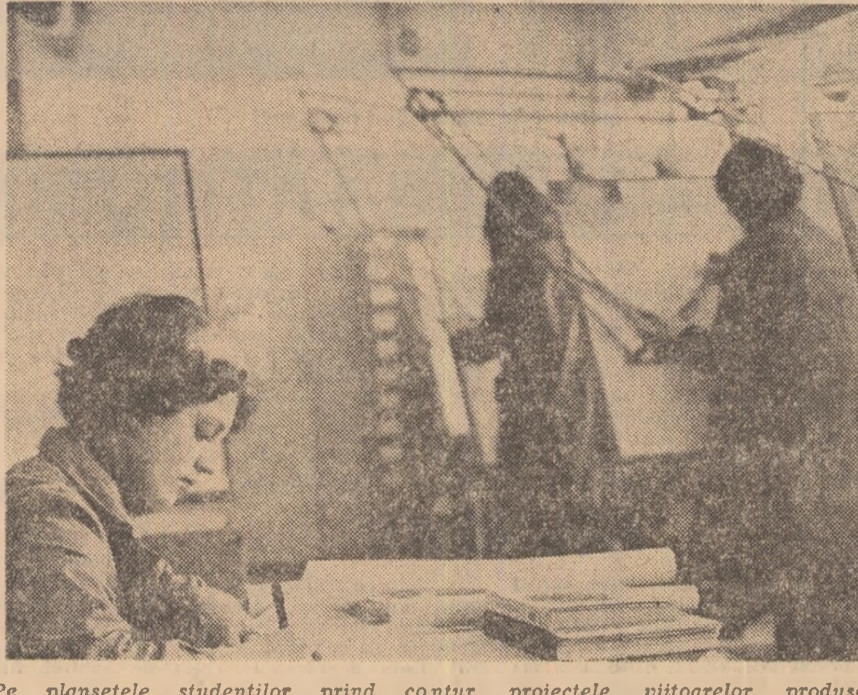
Pe planșetele studenților prind contur proiectele viitoarelor produse ale industriei