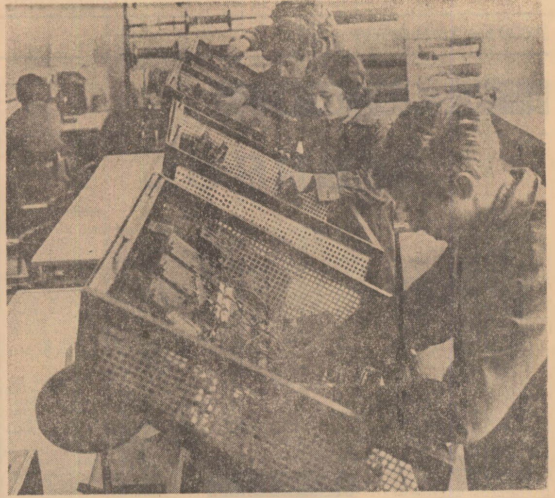
Practică în atelierul microintreprinderii „Celta” a Liceului „Horea, Cloșca și Crișan” din Alba Iulia.