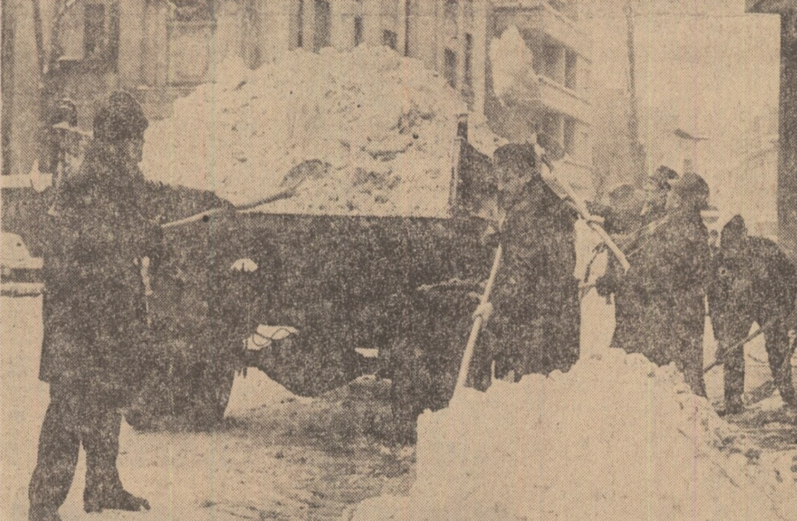
O imagine de actualitate: largă participare cetățenească la degajarea zăpezii.