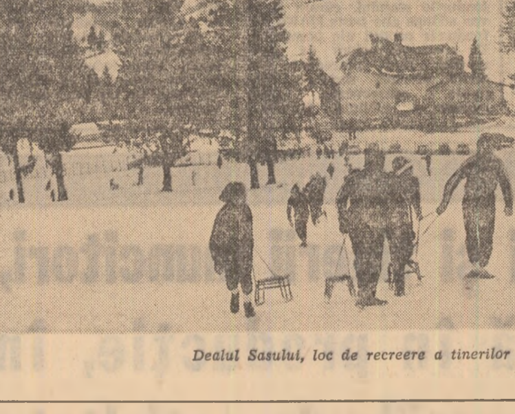
Dealul Sasului, loc de recreere a tinerilor argeșeni.

Solidaritatea exemplară cu luptele muncitorilor din 1933 a fost încă o dată în evidență față de frontal unic reprezentația de boită a unității forțelor democratice, antifasciste din România. Tineretul muncitor, care a dovedit o deosebită conștientizare a acțiunilor în fruntea și în spatele atelierelor, fabricilor, o via unitate a tineretului muncitoresc, de bun augur pentru etapa revoluției populare.