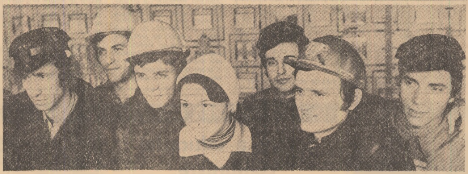
„Schimbul tineretului” de la instalația de distilare atmosferică și în vid a fiteului — Combinatul petrochimic Teleajen