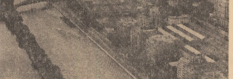
Imagine panoramică a marilor Senei, străjuite de siluetele blocurilor vechi și noi, într-o imbinare ce conferă capitalei franceze atributele frumuseții și originalității

● IN ORASUL LEOBEN, important centru industrial din landul austriac Steiermark, s-a deschis o expoziție de artă plastică românească contemporană. La vernisaj au fost prezente reprezentanți ai vieții publice din Leoben, ziariști, un numeros public.