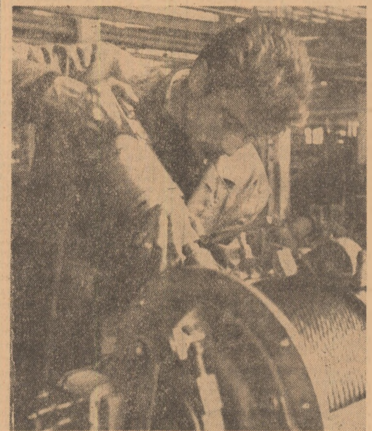
La întreprinderea de masini de ridicat din Gabrovo, ca pretutindeni în țară, tinerii se află în primele rânduri ale luptei pentru creșterea producției.