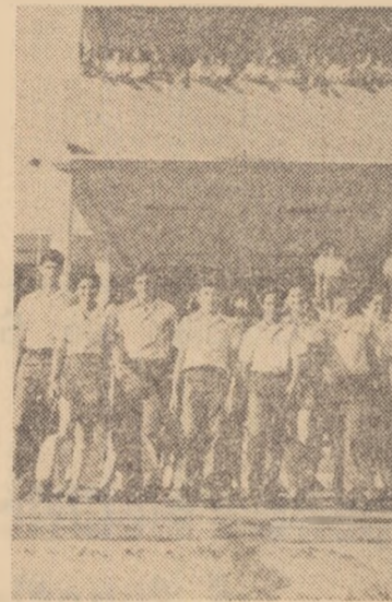
CUBA — Școala pedagogică din Cienfuegos