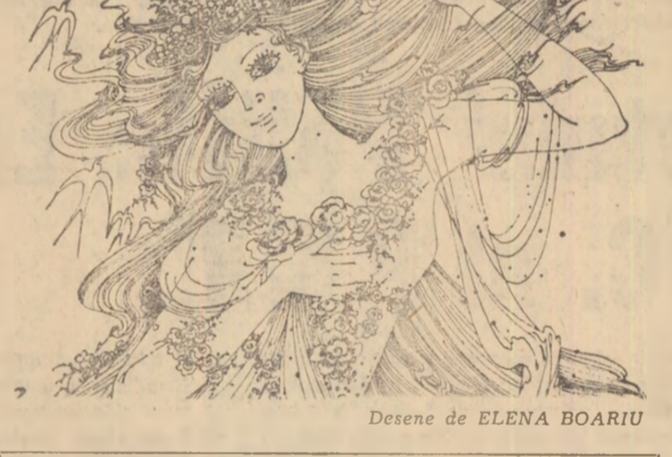
Desene de ELENA BOARIU