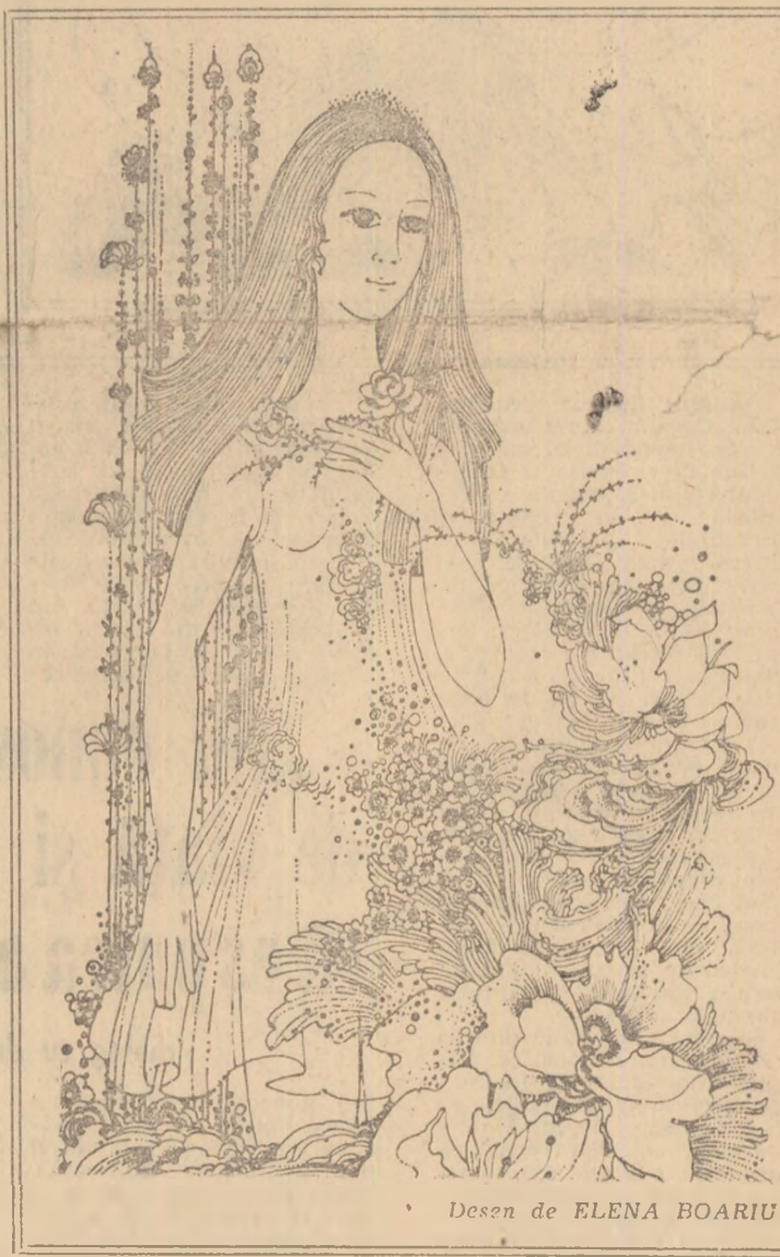
Desen de ELENA BOARIU