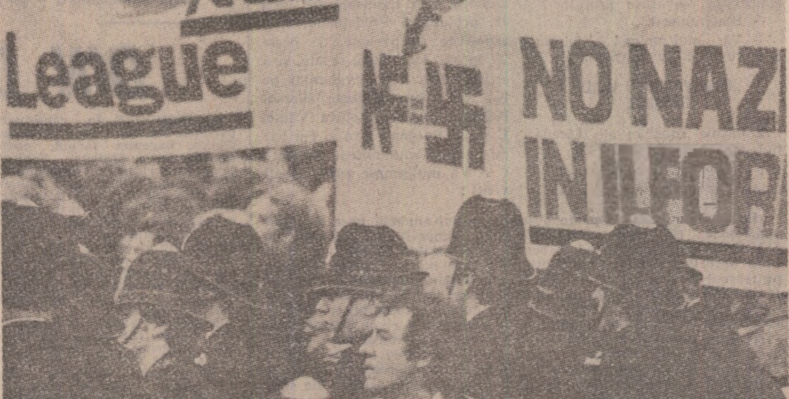
Recent, în Marea Britanie au avut loc ample demonstrații împotriva Frontului Național, organizație de extremă dreapta, neofascistă.