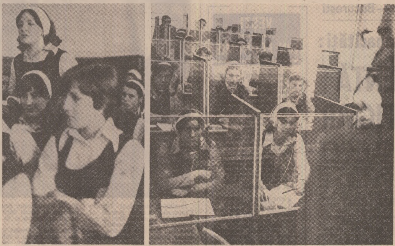
Realizăm ca o formă efectivă și pregătirea pentru muncă și viață a fiecăruia dintre noi oprim cu aceste criterii de exigență cu privire la activitatea școlară.

Pecind de aici, interlocutorul nostru ținea să releve câteva ritmuri semnificative prin care organizația U.T.C. din liceu își propune să concretizeze pregătirea pentru muncă și viață a elevilor. Dacă în anul școlar 1975-1976, procentul de promovabilitate a fost de 90 la sută, iar în cel următor de 92 la sută, pentru finele acestui an școlar se preestimează un procent de peste 95 la sută. Dealtfel, rezultatele cu care