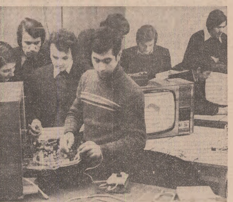
Cercul de depanare Radio-TV al Casei de cultură din Ploiești