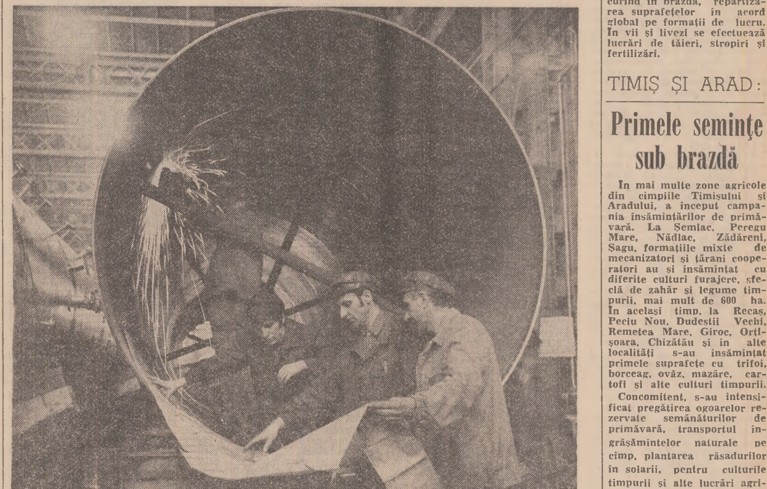
La „Grîștia roșie” prind viața proiectele unor noi și moderne instalații destinate chimiei