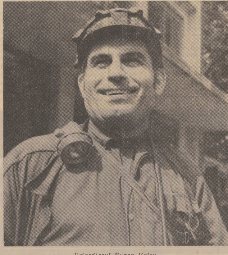
Brigadierul Eugen Voicu