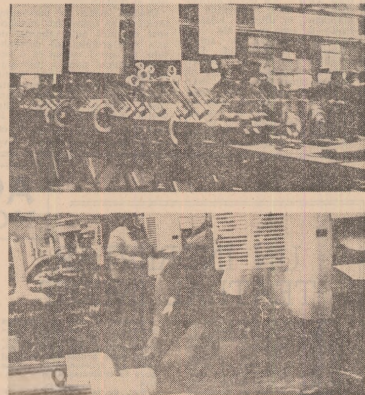
Instalații și utilaje moderne care nu funcționează, operații manuale care-și așteaptă modernizarea

cii și plan — că numărul scrisorilor nu a fost densitate de natură să scuze, ci mai degrabă să acuze o stare pe care nici măcar cifrele nu o mai ascund. Tot alături de fragilitate sînt intențiile conducerei combinatei, încercarea paleativă a plăcii fibrolemnoase și introducerea de electrocare în secțiile vor îmbunătăți fără îndoială transportul uzinal, dar în nici un caz nu vor reduce posturile de garderobiere sau cele de la spații verzi. Care este soluția? Iată o întrebare pe care am adresat-o și secretarului comitetului U.T.C. al combinatului în speranța că vom găsi un răspuns în care să se rezăsească și un angajament al tinerilor prin care ei, prin acțiuni specifice, să facă un pas, un prim pas în direcția reducerii numărului de auxiliarii. Răspunsul a fost însă o ridicare din umeri și o vagă promisiune. Nimic care să convingă că, într-adevăr, în scurt timp se va produce un real progres în ceea ce privește integrarea mai bună a muncitorilor indirect productivi și auxiliarii, plasarea lor în acele activități, care pot oferi o eficiență mai mare producției. În această situație poate doar centrala și factorii de răspundere de la nivelul municipiului ar putea face ceea ce conducerea combinatului, organizația U.T.C. ezită să o facă. De aceea adevărat în acest sens și un necesar apel la acțiuni mai hotărîte care să-și dovedească neîntîrziat eficiența.