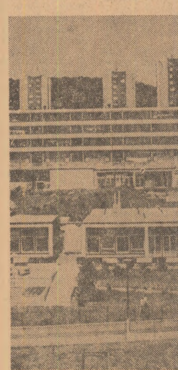
R. S. CEHOSLOVACĂ. Construcții noi la Bratislava

„Nu pot spune că am reușit deosebit de vederi asupra acestui punct”, a declarat, la încheierea convorbirilor americano-israeliene, secretarul de stat Cyrus Vance.