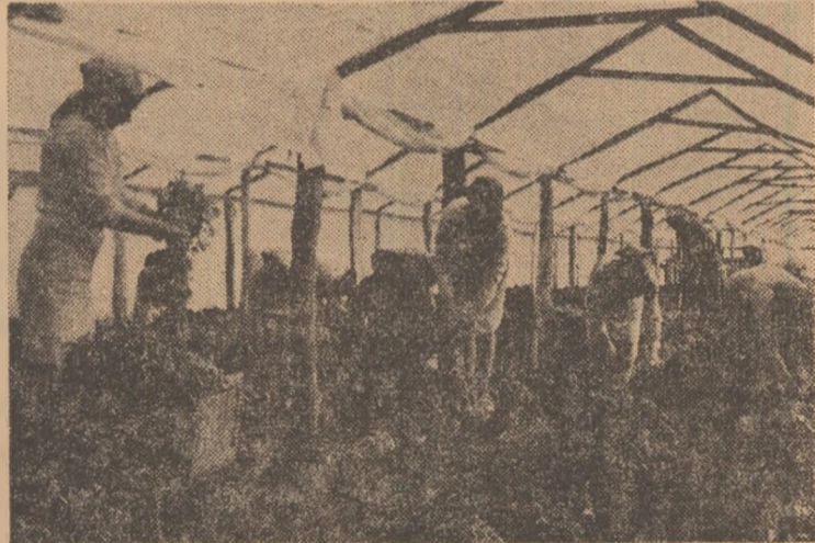
În solarii, se muncește la plantățiile tomatei.