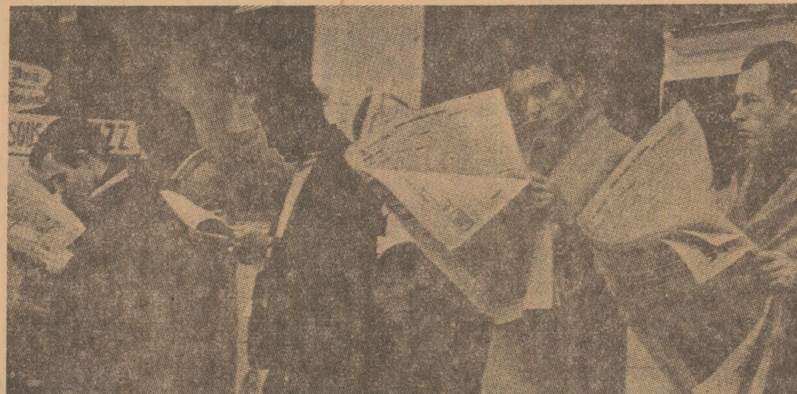
CAUTĂRI ZADARNICE... Muncitori emigranți în Franța urmărind în paginile ziarelor oferte de servicii în speranța găsirii unui loc de muncă

● LA Jakarta, a avut loc, ieri, ceremonia depunerii jurământului