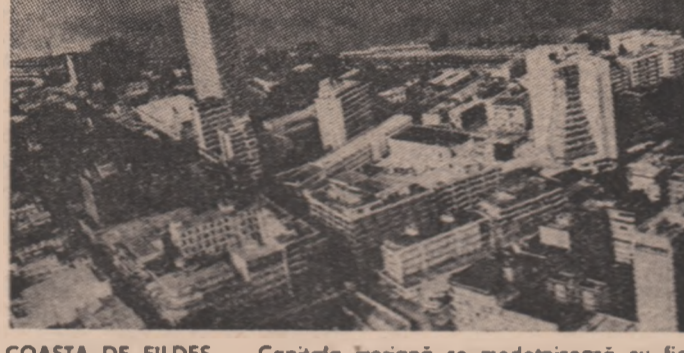
COASTA DE FILDEȘ — Capitala irovană se modernizează cu înalta viteză

În zilele de 29 și 30 martie a avut loc la Moscova ședința a 16-a a Comitetului C.A.E.R. pentru colaborare în domeniul activității de planificare.