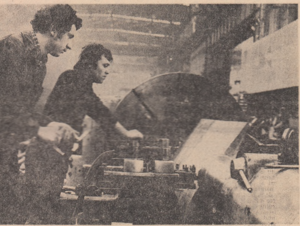
Doi dintre cei mai harnici tineri ai secției de mecanică grea a Întreprinderii constructoare de mașini Reșița.

La Galați, în cadrul activității de creație științifică și tehnică de masă, au avut loc manifestări de amploare care programează expuneri, dezbateri simpozionale, conferințe, expoziții pe tema promovării consecvențe a progresului tehnic în toate domeniile economiei. Astfel, la Casa de cultură a studenților din Galați s-a deschis în unificarea economică gălățeană. O altă expoziție de creație tehnico-aplicativă a fost deschisă și la Casa pionierilor din Galați, iar la Clubul Comunitar siderurgic a fost organizată o expoziție cu privire la activitatea de creație științifică și tehnică.