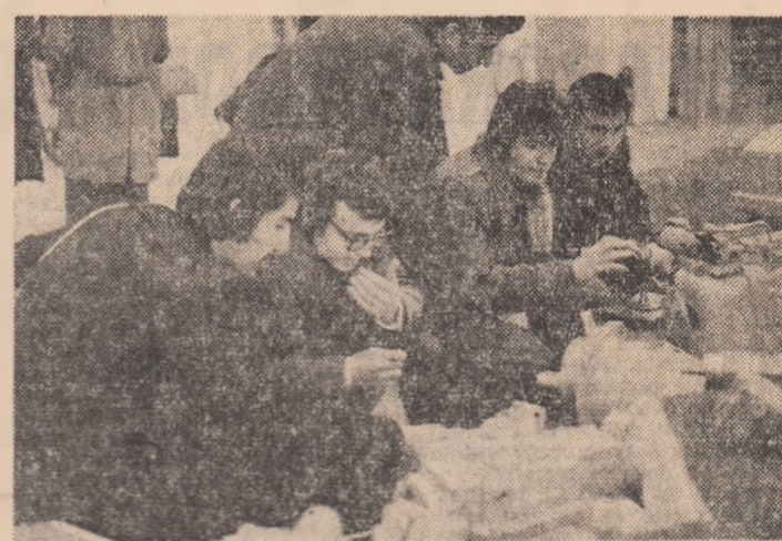
Acești tineri adânciți în deslusirea unor produse noi, de o tehnicitate deosebită, prezentate de Intreprinderea mecanică Plopieni, par să ne spună că singura pofte încomodă în actualitatea de cunoaștere, înțelegere și afirmare a noului este doar aceea care-i face pe unii — din fericire, pe zi ce trece tot mai puțină — să treacă cu indifferență pe lângă nou