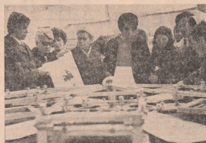
La standul industriei ușoare, unul din exponatele care atrag în mod deosebit atenția este mașina de imprimare a produselor confecționate, în patru culori, înscenaj realizat de un colectiv de la Intreprinderea de Tricotaje „Zăvoaia“ Suceava...