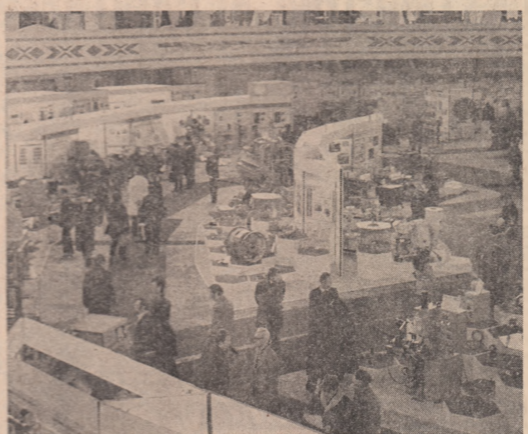
Mii de promotori ai noului drum științific, printre care numeroși tineri, participă în aceste zile la un amplu și rodnic schimb de experiență și idei în cadrul fetei oferite de „Expoziția națională de creație științifică și tehnică”

Zile de miercuri, cea de-a treia de la deschiderea „Săptămîni științifice și tehnice românești”, a consecutat în saloanele dezbaterilor manifestările din cadrul expoziției a seriei de dezbateri realizate la standul fir-căruș minister economic și sector de activitate prezent în