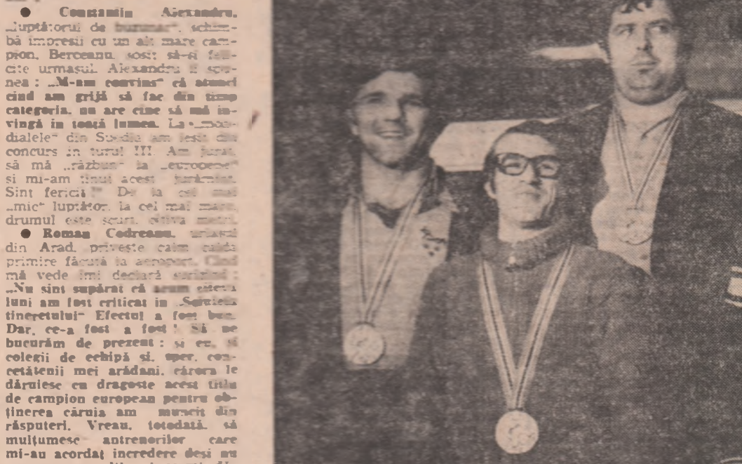
Cei patru medaliați cu aur la sesiunea pe Aerodromul Internațional Otopeni.

namo de altădată poate fi învinș de Petrolul, însă nici un rezultat de egalitate nu cred să fie exclus cu desăvîșire. La Oradea, cred că Argoviștenii nu au șanse. Ai, dacă bioștenii mai produc o surpriză, situația lor devine critică. Steaua joacă, din nou, pe terenul propriu. Nu va scăpa ocazia să-și ia revanșa în fața studenților (jocul, după înfrîngerea suferită în fața lor, săptămîna trecută, în meciul de „cupă” de la Galați. Echipa din Copou cred că ar fi preferat să cîștige mai degrabă meciul de minie. La Craiova, un meci în care gazdele au prima șansă. E posibilă și o surpriză. Echipa noastră a realizat, în prima parte a campionatului, rezultate de egalitate. De ce n-am sparge ghiocul tocmai în meciul de minie?