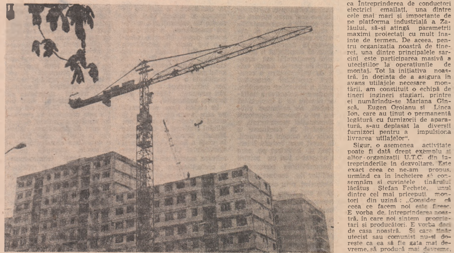
Drobeta-Turnu Severin. Construcții de locuințe spre cota finală.