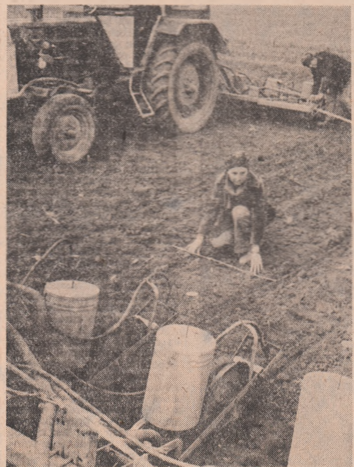
Alte vești din campania semănăturii

Județul DÎMBOVIȚA Muncind cu dăruire și pasiune, lucrătorii ogoarelor din județul Dimbovița, în frunte cu comunistii, au raportat în ziua de 25 aprilie, încheierea însămînțării porumbului. Totodată, ei au acționat cu forțe sporite la fertilizarea și erbicidarea grânelor, plantării legumelor, la executarea lucrărilor de sezon în pomicultură și viticultură, la realizarea obiectivelor de îmbunătățiri funciare. Intr-o telegramă adresată C.C. al P.C.R., tovarășului NICOLAE CEAUȘESCU, de Comitetul județean Dimbovița al P.C.R., se arată: Vă asigurăm, mult iubite și stimat tovarășe Nicolae Ceaușescu, că sentimentele de profundă satisfacție și mândrie patriotică, de care sîntem animați, exprimă pe deplin hotărîrea noastră fermă de a nu recupeți nici un efort, de a munci cu pasiune și spirit revoluționar pentru înlăptuirea intelექtului politic al partidului, de a acționa sub semnul unei exemplare mobilizări, a calității și eficienței maxime, pentru materializarea tuturor sarcinilor ce ne revin în acest al treilea an al cincinalului revoluției tehnico-stilntifice, pentru a ne îndeplini angajamentele asumate în întrecerea socialistă, astfel ca în județul nostru agricultura să devină un sector model, de înaltă productivitate, un izvor neseecat al recoltelor bogate.