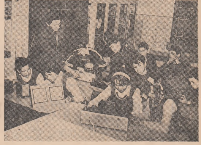
În cabinetul de fizică al școlii

acum a reușit să se înscrie printre cele reprezentative ale satului, datorită unui lung șir de transformări și modernizări făcute de cadrele didactice și elevii care au trecut prin ea.