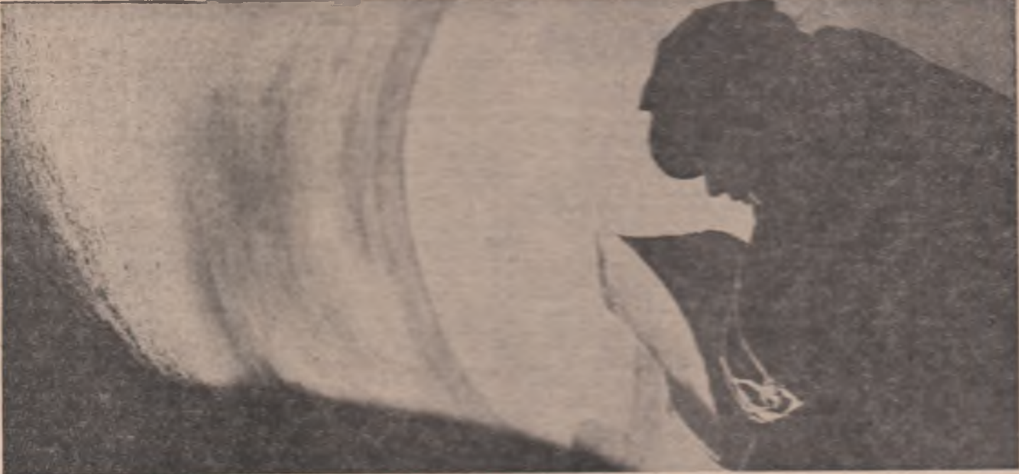
Calitatea bună a lucrărilor, complexitatea utilajelor asociate la I.U.C.-Făgăraș sînt argumente ale valorificării optime a forței de muncă și a armonizării activității individuale cu cea colectivă de muncă.