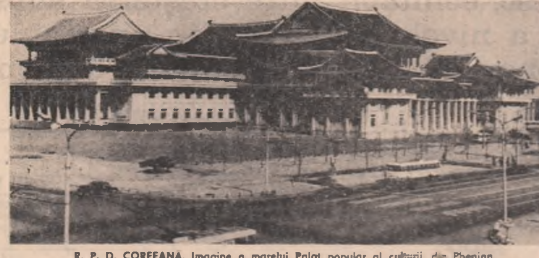
R. P. D. COREANĂ. Imagine a marelui Palat popular al culturii din Phoenia

UN GRUP din cadrul celui mai important partid al coaliției guvernamentale israeliene — Mișcarea Democratică pen-