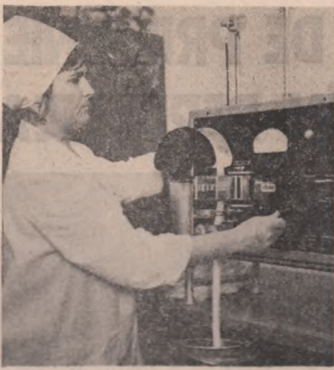
Instanțarea în laboratorul Filateliei Românești de Băncă-București.