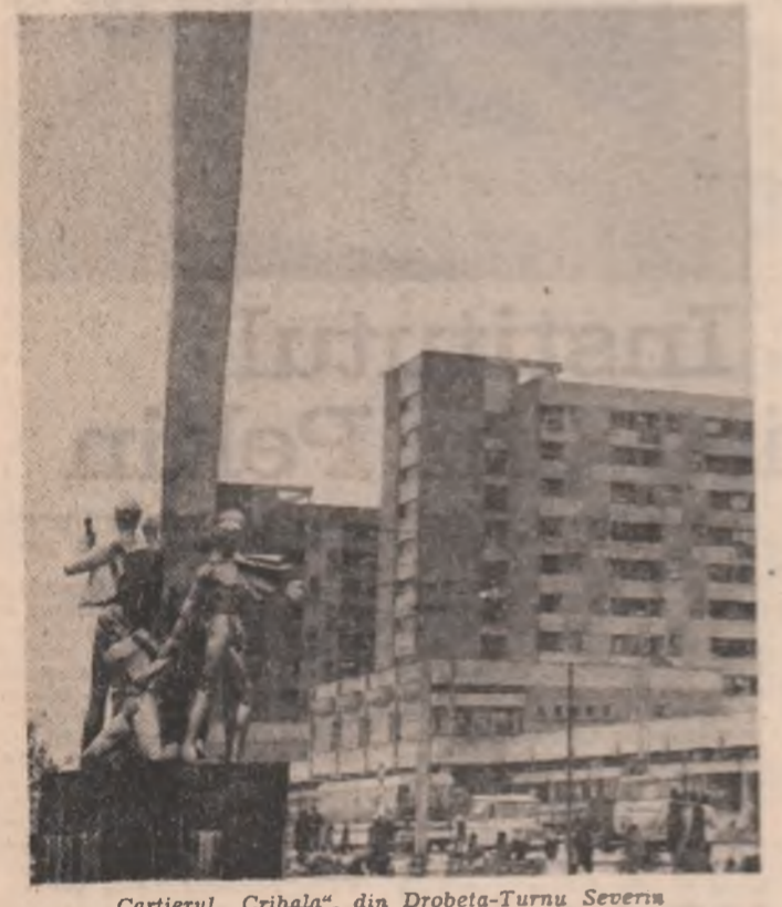
Cartierul „Crihală”, din Drobeta-Turnu Severin.