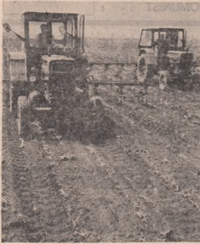
Se acționează intens la prășitul mecanic al porumbului

cultivate cu sfeclă de zahăr, prima prășală manuală se apropie de stadiul final, iar în județele Ialomița, Tulcea, Brăila, Mehedinți, Vrancea, Cluj și Alba aceeași lucrare s-a făcut numai în unitățile agricole cooperative pe mai bine de 75 la sută din prevederi. Prășitul manual la floarea-soarelui s-a încheiat în județul Mehedinți și se desfășoară în plin în județele Dolj, Constanța, Vrancea și Buzău. De menționat că mecanizatorii, odată cu prășitul mecanic, execută și sapa rotativă la porumb, lucrare destul de avansată în județele mari cultivate cu sînt Constanța, Brăila, Buzău, Ialomița etc. și în cele cu suprafețe mai mici ca Prăbova, Dimbovița, Vaslui și Alba. În prezenți în toate județele după încheierea lucrărilor de întreținere la sfeclă de zahăr și floarea-soarelui toate forțele sînt concentrate la prășitul porumbului.