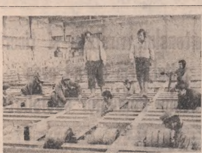
Se acționează intens la prășitul mecanic al porumbului

Ploie din ultima perioadă au grăbit creșterea plantelor cultivate și totodată a buruienilor. Așadar, rămîne prioritară de agenda de lucru a tuturor lucrătorilor ogoarelor din județul Brașov plivirea culturilor; se impune deci ca atît conducerea unităților agricole cît și consiliile populare să acorde un scrijîn deosebit în utilizarea tuturor mijloacelor mecanice, mobilizarea locuitorilor satelor la prășitul și efectuarea celorlalte lucrări de întreținere. La C.A.P. Voia, președintele Tinerii Muncii se spunea că sînt se folosesc foarte cîtă bună de lucru pentru prășitul stărilor de zahăr, cultura arșărită în totalitate în acord global. La această lucrare sînt prezenți toți locuitorii satelor, mecanizatorii și cooperatorii. În cadrul C.A.P. Crișna unde s-a efectuat în bună parte rebelionatul cartofilor. Pe suprafețele însămînțate cu salicari furajieri mai de timpuriu există unele parșale bine întreținute iar altele, din pricina lipsei de îngrijire, sînt amenințate să dispară sub buruieni. Se impune, deci, din partea conducerii cooperativei luarea unor măsuri