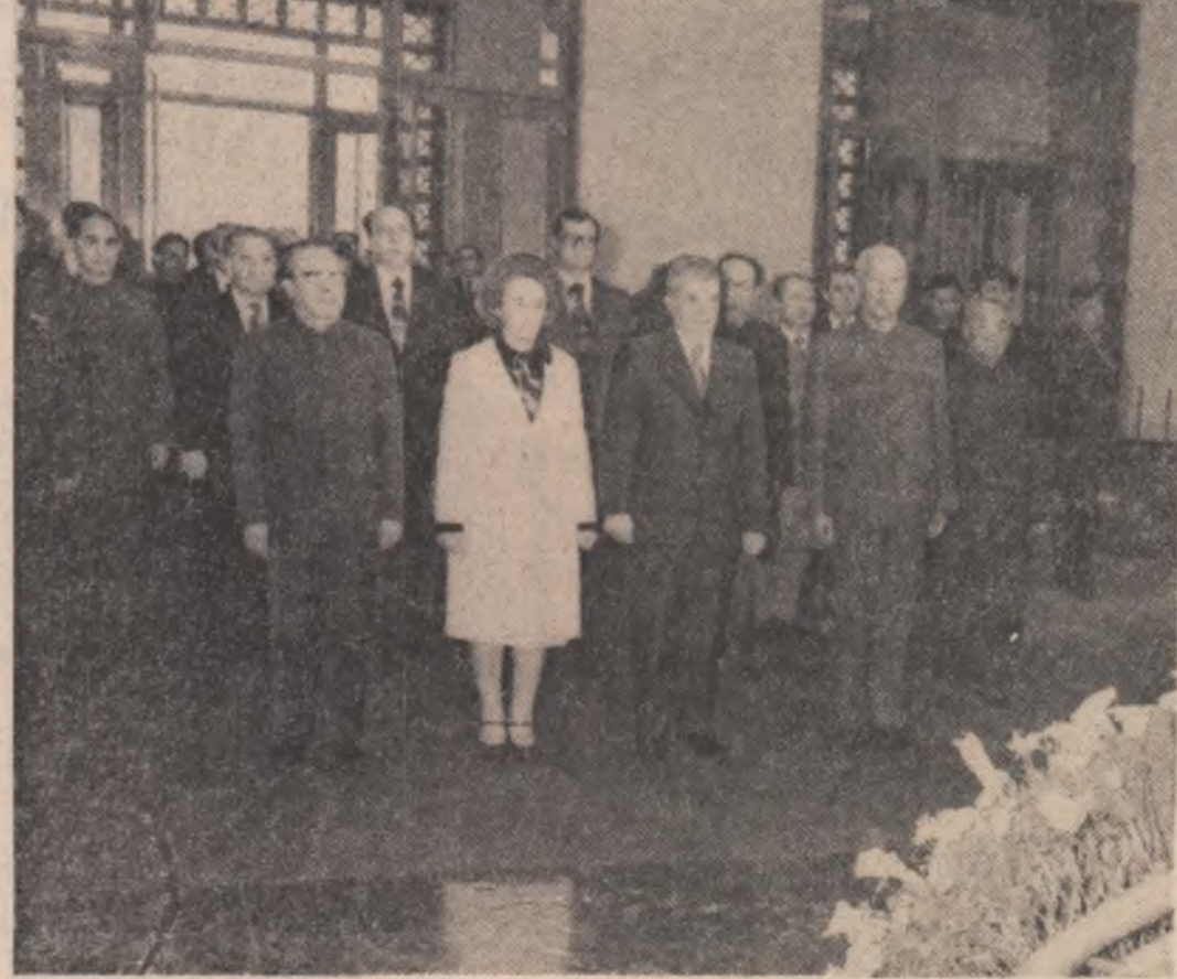
La Mausoleul președintelui Mao Tzedun