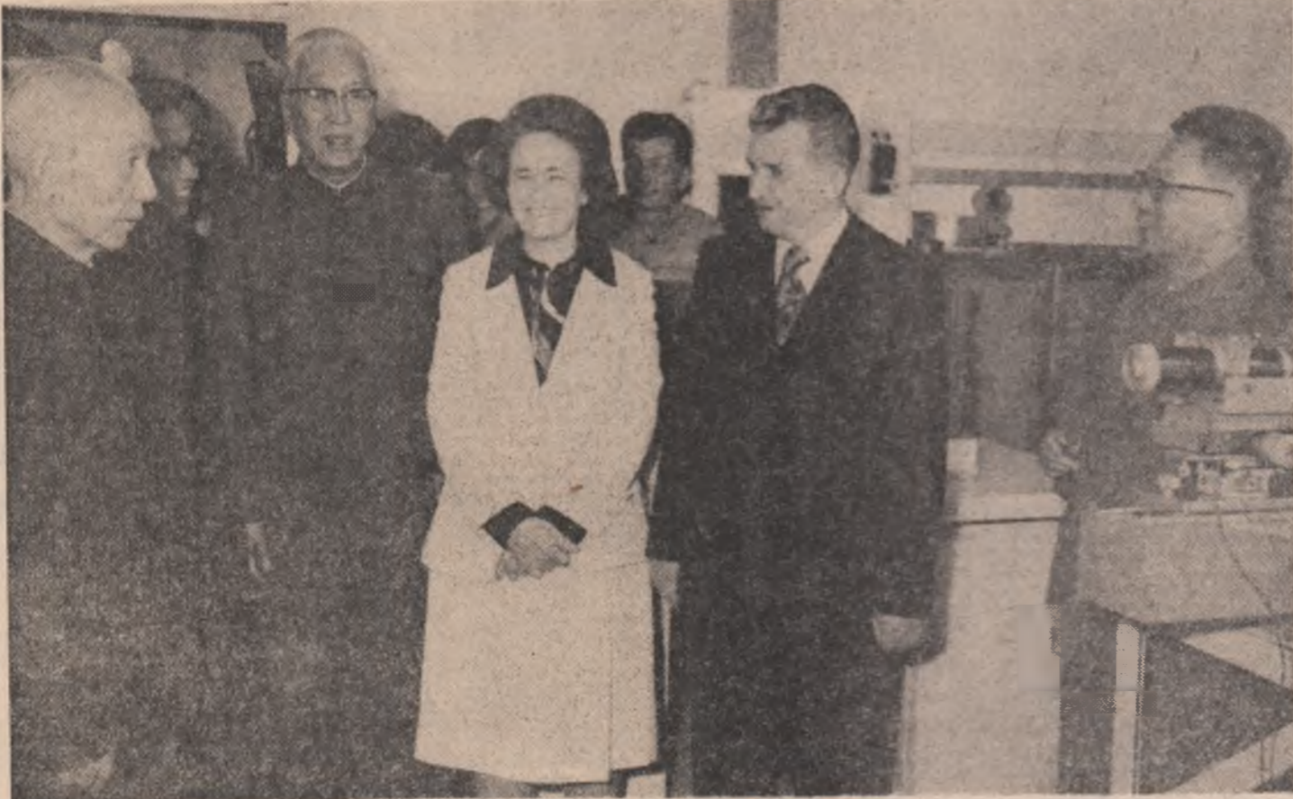
Înălții oaspeți români în vizită la Institutul de fizică din Pekin

O delegație de partid și de stat, condusă de tovarășul Nicolae Ceaușescu, va face o vizită oficială de prietenie în Republica Socialistă Vietnam