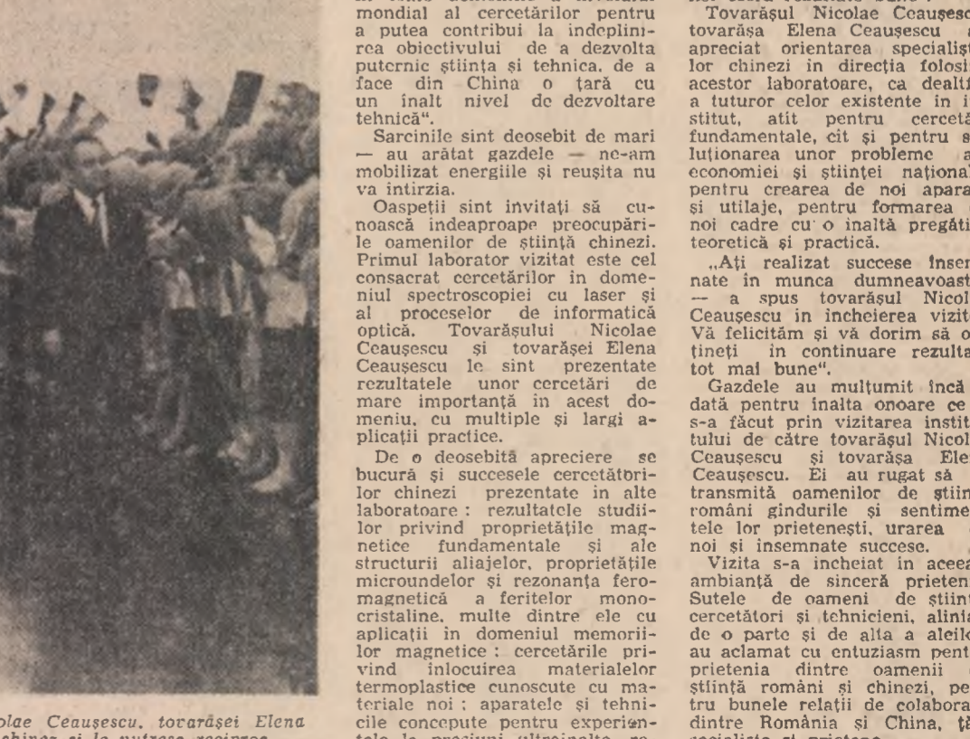
Populația Cantonului — vîrstnici și tineri — a rezervat o primire sărbătorească tovarășului Nicolae Ceaușescu, tovarășei Elena Ceaușescu, expresie a sentimentelor de deosebită simț și prețuire pe care popoarele română și chineză și le nutresc reciproc

În cadrul discuției, tovarășii Nicolae Ceaușescu și tovarășii Uei Kuo-cin au vorbit despre problemele de colaborare dintre România și China și despre rolul Chinei în dezvoltarea economiei naționale și în dezvoltarea culturii. În cadrul discuției, tovarășii Nicolae Ceaușescu și tovarășii Uei Kuo-cin au vorbit despre problemele de colaborare dintre România și China și despre rolul Chinei în dezvoltarea economiei naționale și în dezvoltarea culturii. În cadrul discuției, tovarășii Nicolae Ceaușescu și tovarășii Uei Kuo-cin au vorbit despre problemele de colaborare dintre România și China și despre rolul Chinei în dezvoltarea economiei naționale și în dezvoltarea culturii. În cadrul discuției, tovarășii Nicolae Ceaușescu și tovarășii Uei Kuo-cin au vorbit despre problemele de colaborare dintre România și China și despre rolul Chinei în dezvoltarea economiei naționale și în dezvoltarea culturii.