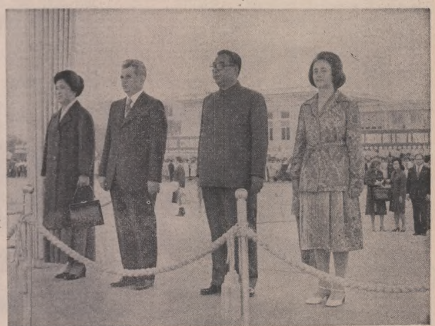
În timpul ceremoniei soșirii pe aeroportul din Phenian

La acest mare miting al prieteniei româno-coreene, am deosebită plăcere de a vă adresa dumneavoastră, tovarășe Kim Ir Sen, cel mai cordial salut tovarășesc, de prietenie și solidaritate. De asemenea, adresez tuturor participanților la miting, locuitorilor orașului erou Phenian, întregului popor coreean prieten, un salut frățesc din partea poporului român, a partidului și statului nostru, precum și din partea mea personală, împreună cu cele mai bune urări.