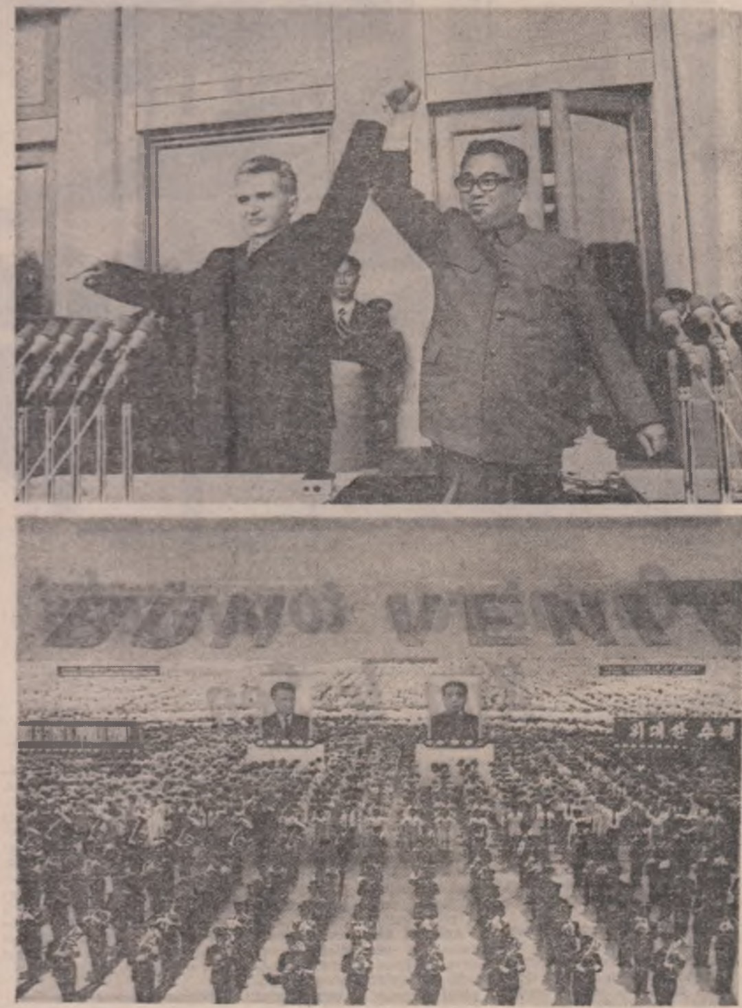
Doi memorabile imagini-simbol de la marelle miting al prieteniei româno-coreean și de la grandiosul spectacol cultural-sportiv de pe stadionul Moranbon