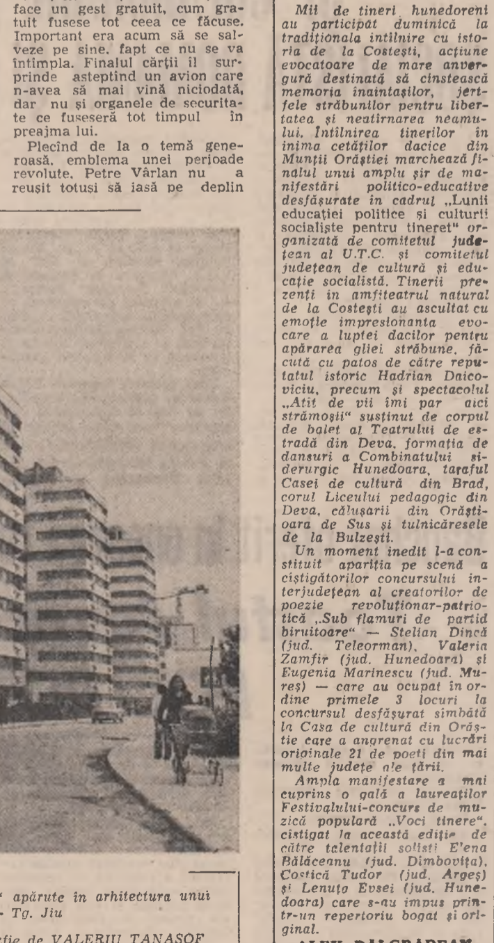
Noile „coloane ale infinitului” apărute în arhitectura unui vechi oraș — Tg. Jiu