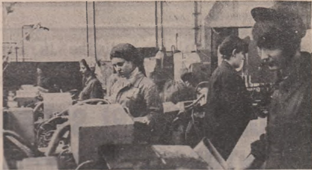
Din cronica intrecerilor socialiste

● OAMENII MUNCII DIN INDUSTRIA JUDEȚULUI HUNEDOARA au îndeplinit cu 3 zile mai devreme, sarcinile de plan pe primele 5 luni ale anului. Prin obținerea acestui succes, care are la bază perfecționarea tehnologiilor de lucru, folosirea cu randament sporit a mașinilor, agregatelor și spațiilor productive, organizarea mai judicioasă a activității productive s-a creat premisele obținerii unei producții industriale suplimentare, până la sfârșitul lunii mai, în valoare de peste 200 milioane lei. Cu toate acestea, în luna aprilie, producția industrială hunedoară va produce și în luna mai, în plus economii naționale, peste 50 milioane kWh energie electrică, 20.000 tone oțel, 20.000 tone sârmă, 15.000 tone laminat fieros, 6.000 tone ciment, 5.500 mp placaj fieros de marmură și innumerate cantități de alte produse.