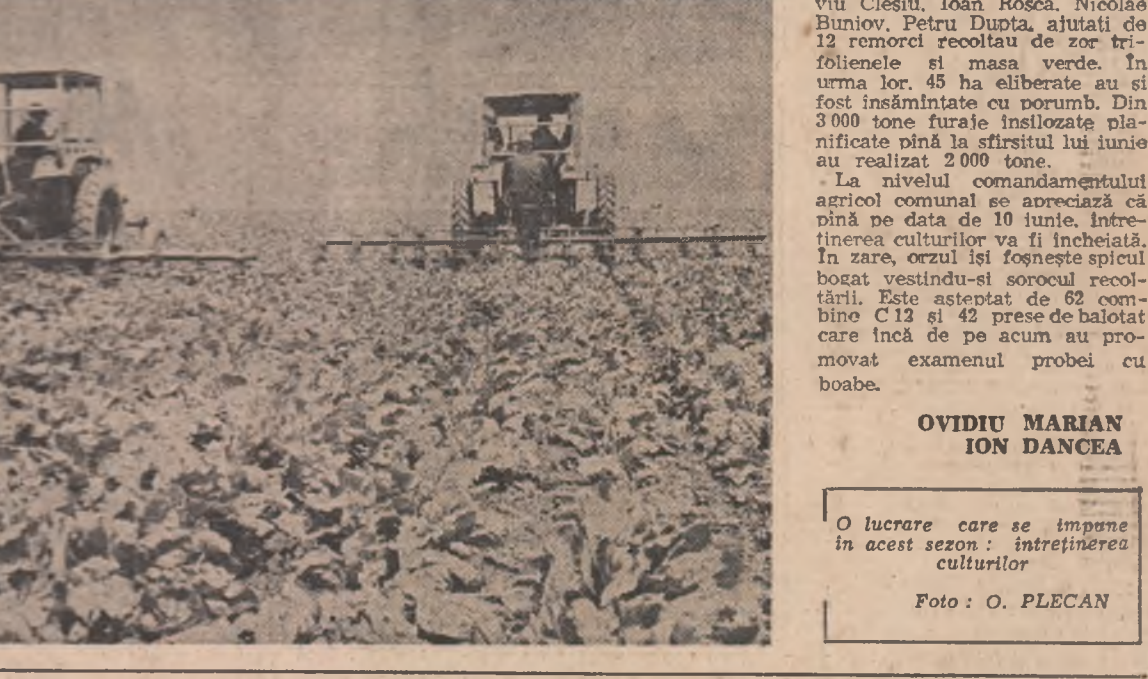
O lucrare care se impune în acest sezon: întreținerea culturilor.

TINERETUL - FACTOR ACTIV ÎN REALIZAREA CINCINALURII REVOLUȚIONARE ȘTIINȚIFICE... Inițiativele valoroase, experiențele avansate - larg promovate și generalizate