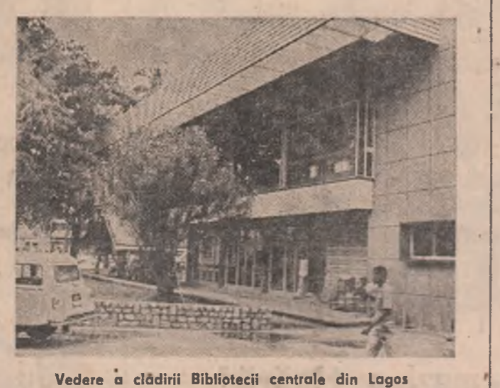
Vedere a clădirii Bibliotecii centrale din Lagos

Pentru a conferi o mai înaltă eficiență economiei și a asigura pe această cale creșterea veniturilor naționali, s-a trecut la construirea unui șir de obiective industriale care să prelucereze materiile prime existente. Astfel, la Port Harcourt — una din principalele porți maritime ale țării — au fost înalte un mare complex petrochimic și un laminar de aluminiu, la Afam a fost construită o centrală electrică la Kinji, pe fluviul Niger, o hidrocentrală cu o putere instalată de 900.000 kW. De asemenea, au fost ridicate fabrici de ciment, îngrășăminte chimice, de produse alimentare, textile etc. Se extinde și se diversifică valorificarea altor importante resurse naturale — pădurile ecuatoriale și tropicale cu esențe prețioase, care acop-