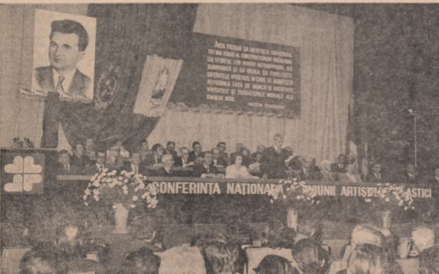
CONFERINȚA NAȚIONALĂ A UNIUNII ARTIȘTILOR PLASTICI

Telegrame de felicitare adresate tovarășei Elena Ceaușescu, pentru înaltele titluri academice conferite cu prilejul vizitei în Marea Britanie. (ÎN PAGINA A IV-A)