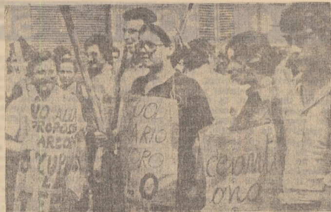
Aspect din timpul unei demonstrații desfășurate recent în Italia în semn de protest față de lipsa locurilor de muncă în regiunile din sudul țării.

statat, de asemenea, că în cazul familiilor bogate aveau lor a sporit în perioada menționată deosebit de repede, rata de creștere anuală fiind uneori de 10-12 la sută. În această situație pare „infinit” ca venitul anual al unui număr de 20 de familii franceze, cele mai bogate, depășește, conform cotidianului „Liberté”, 100 milioane franci, iar 200.000 de astfel de familii avute realizează un venit net de 11 miliarde franci, ceea ce echivalază