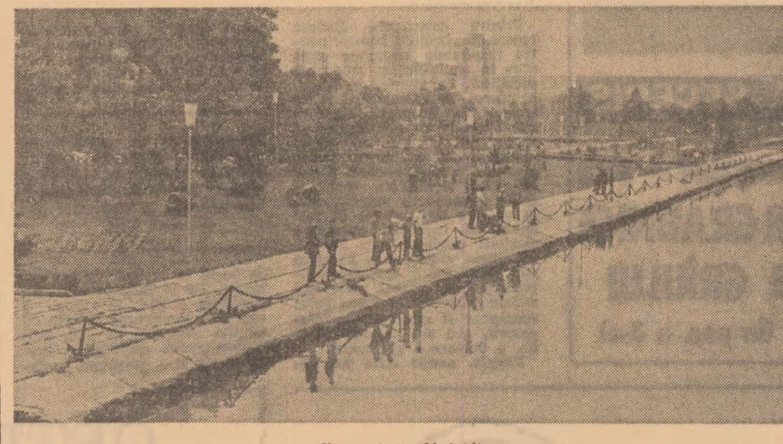
Ilustrat din Megădia