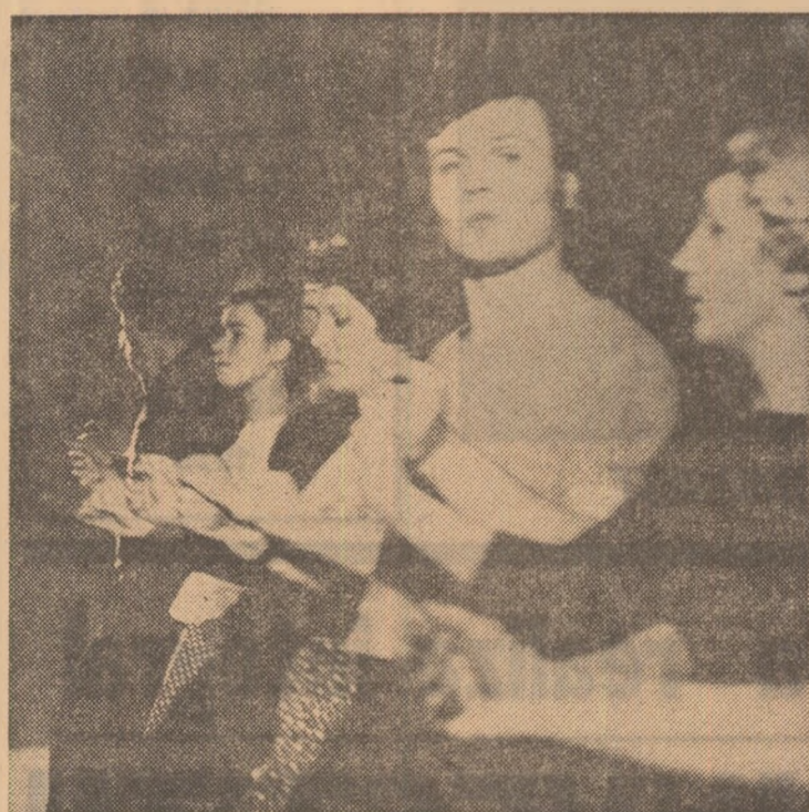
Repetiție la Casa de cultură din Ploiești.