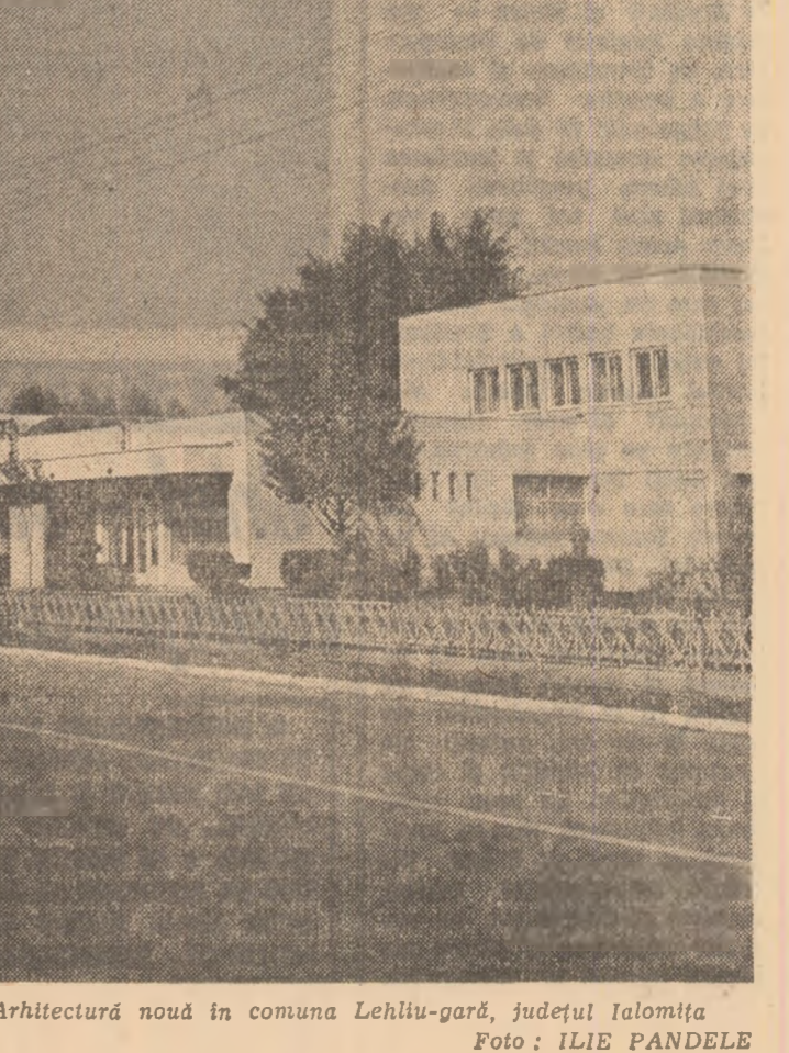
Arhitectură nouă în comuna Lehliu-gară, județul Ialomița.

● În localitatea Filiași, județul Dolj, aflată la intersecția a două importante șosele București — Craiova — Timișoara și București — Craiova — Tirgu Jiu — Petroșani, a fost dată în folo-