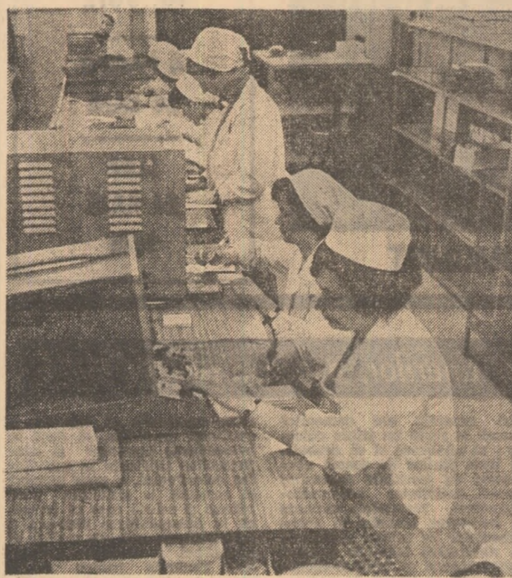
Electronica — o meserie care cere precizie și minuțiozitate de ceașornicar