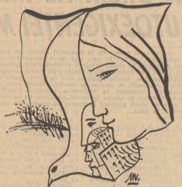
Desen de MIHU VULCANESCU